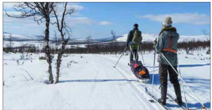
Komeita maisemia Muotkatuntureilla.