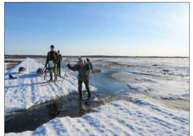
Suot tulvivat helteisessä kelissä.