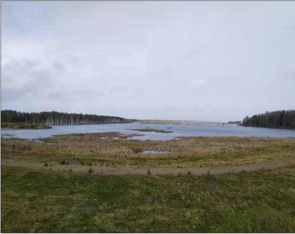
Puurijärven-Isosuon kansallispuistossa suota piisaa.