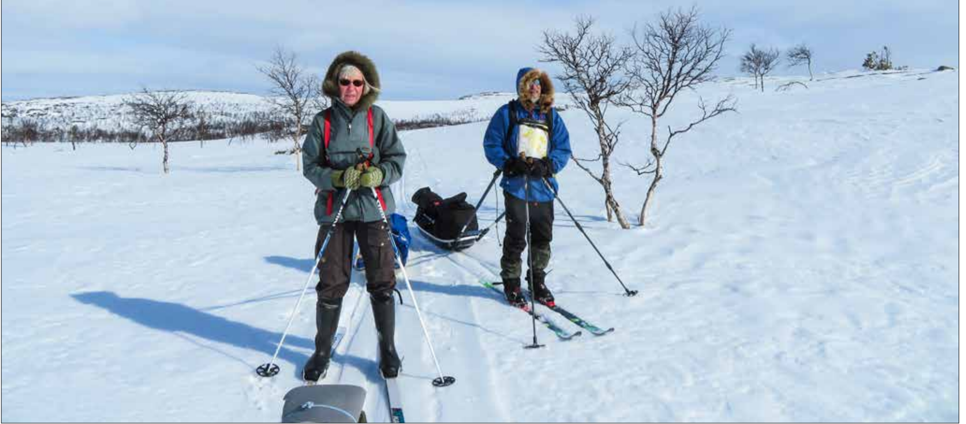
Muotkatuntureilla paljakassa oli vielä melko talviset kelit.

Kolbmallalla oli tänä vuonna kevään ohjelmassa pitkä, pariviikkoinen 300 kilometrin mittainen johtajasusi-hiihtovaellus. Pääsiäisen ja Tunturiladun kevätpäivien myöhäinen ajankohta ajoittivat vaelluksen huhtikuun loppuun.