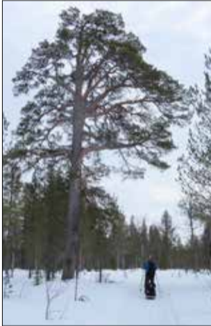
Hakkuilta säästynyt mänty Paaraskallassa.

Lumi alkoi pettää yleensä viimeistään puolenpäivän aikaan. Kelkkauria jouduttiin etsimään käytännössä koko ajan. Parina yönä oli