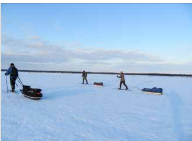
Aamuyön hankikanto Nautajängällä.

Vaellus alkoi Kiellajoelta 12.huhtikuuta ja päättyi keväisissä olosuhteissa Peltovuomaan 25. huhtikuuta. Reitti kulki Muotkatuntureilla paljakassa, mistä löytyi poromiesten tekemä vasomisalu-