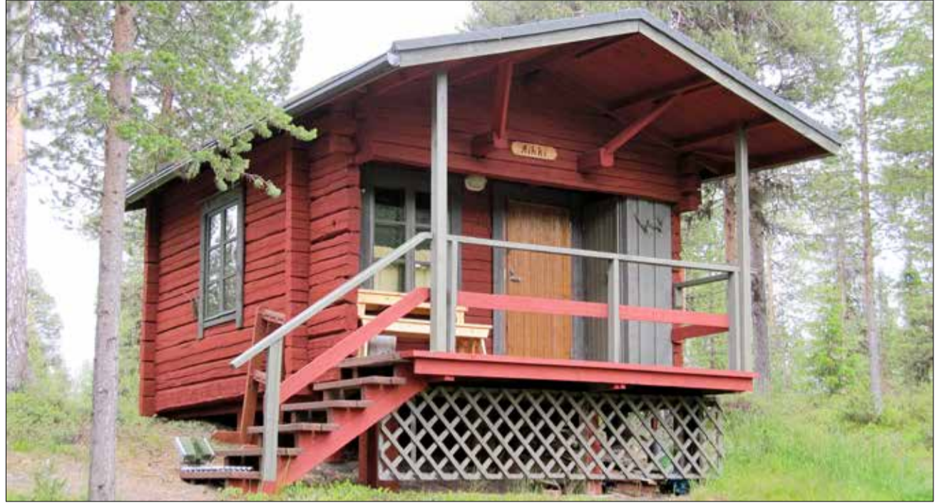
Aihki on suosittu varauskohde Susikyrollä pihapiirissä.

11. Aihkilla ja Susikyrollä on yhteinen kaivo ja puuliiteri, joiden käyttöoikeus on Aihkin vuokraajalla, samoin kuin oikeus käyttää Susikyrollä rantasaunaa, Pekan-Oskaria ja