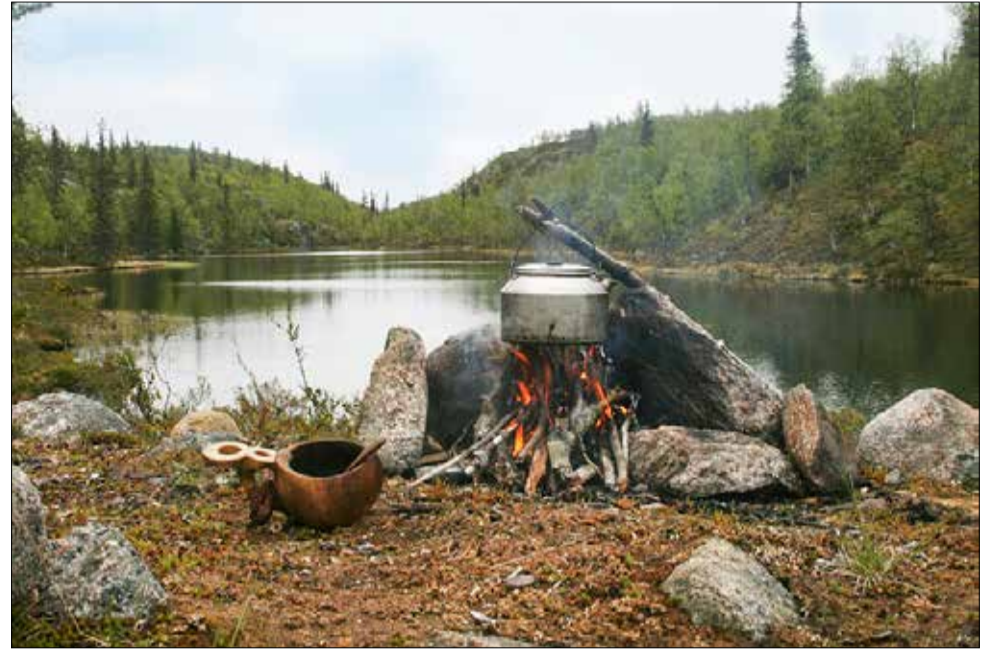
Pahakurun yläosassa sijaitseva lampi on kaunis ja rauhallinen kahvisteluapaikka.

Kivijärvessä on noin neljä metriä korkea monien tarinoiden ”Vetehisenkivi”. Kolttakulttuuriin liittyy sekin pieni lammasspuura, joka on Talasjärven pohjoispään itärannalla Susi-Talakselle vie-