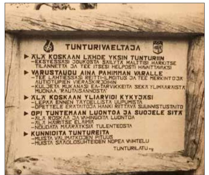
Tunturivaeltajan käskyt ovat yhä käyttökelpoiset.

Tunturivaeltajan käsky n:o 2 ”Varustaudu aina pahimman varalta” velvoittaa retkeilijää suunnittelemaan reitin etukäteen ja myös ilmoittamaan sen majapaikkaan. ”Se on kohtelias tapa, joka sitä paitsi helpottaa suuresti etsi- jöittäsi työtä, jos Sinua jou-