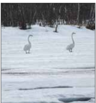
Joutsenia Vaschojen Kutusuvannossa.

lähemmäs kymmenen asteen pakkaskeli, joten aamuyöstä liikkeelle lähtien päästiin hiihtämään hangilla pari isoa suo-osuutta.