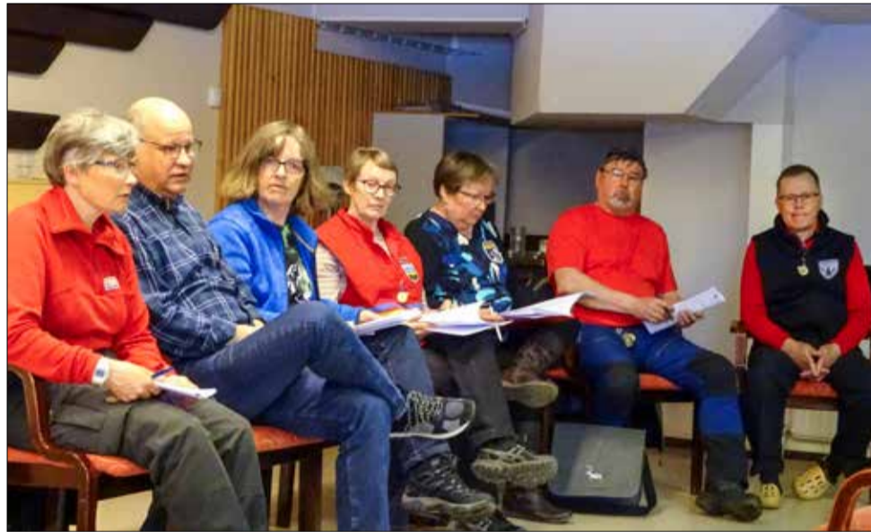
Johtokunta odottaa kysymyksiä

Teksti: Tuula Forström