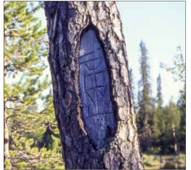
Asentolammen petäjä. Onko joku joskus muinoin puumerkillään halunnut osoittaa asentopaikan kuuluvan hänelle?