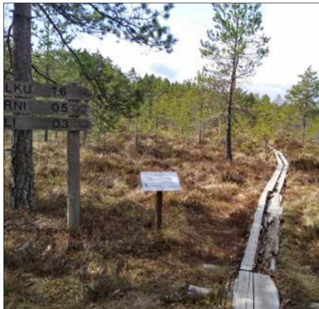
Isosuon pitkospuut ovat paikka paikoin heikkokuntoiset ja suolla oleva lintutorni on toistaiseksi käyttökiellossa.