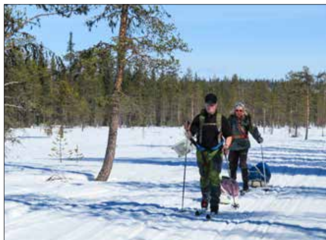
Jälkimmäinen viikko hiihrettiin kelkkauraa.