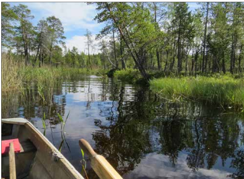
Talasjuuha laskee Talasjärveen kaislikon läpi. Raivostuttavan mutkaista jokea voi soutaa noin kilometrin verran ylävirtaan.