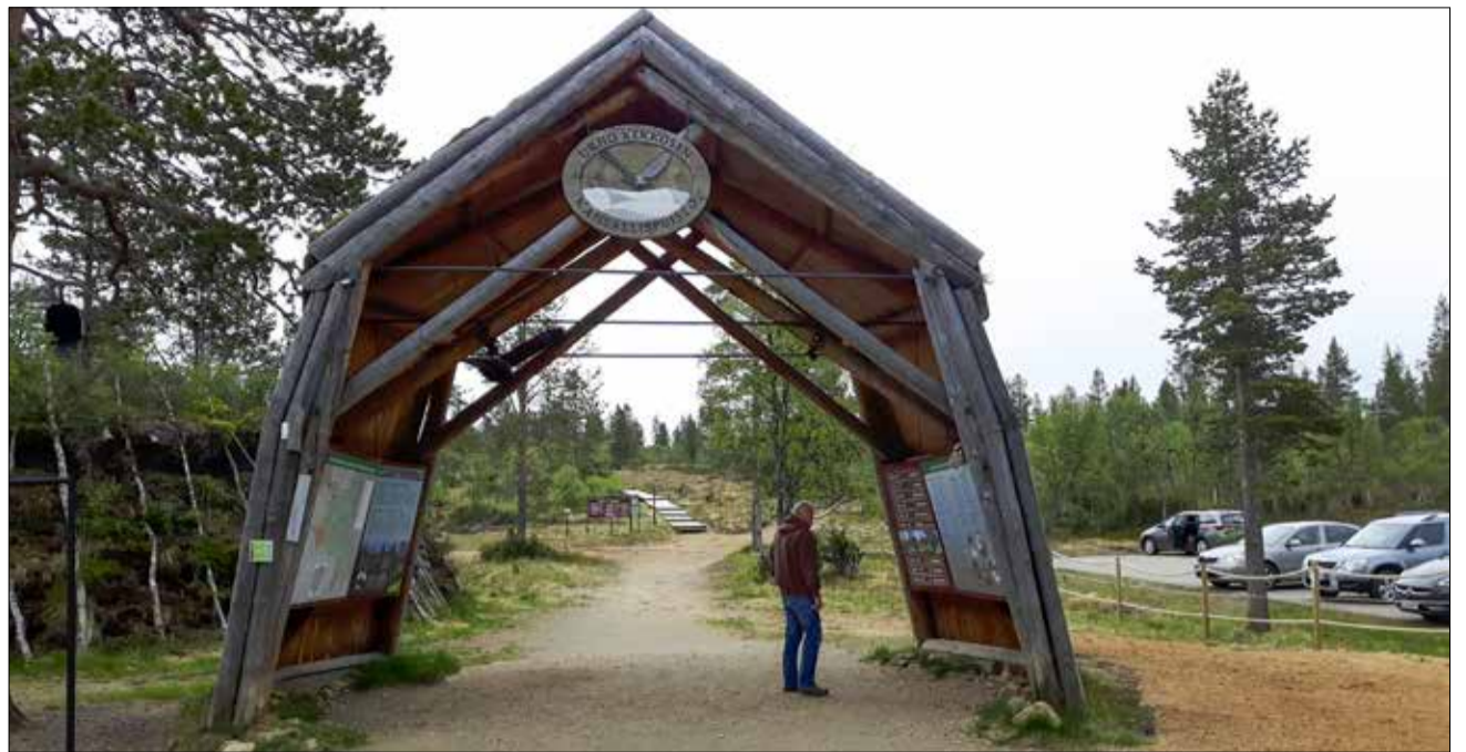
Kiilopään portista on lähdetty monille vaelluksille ja tultu maaliin.