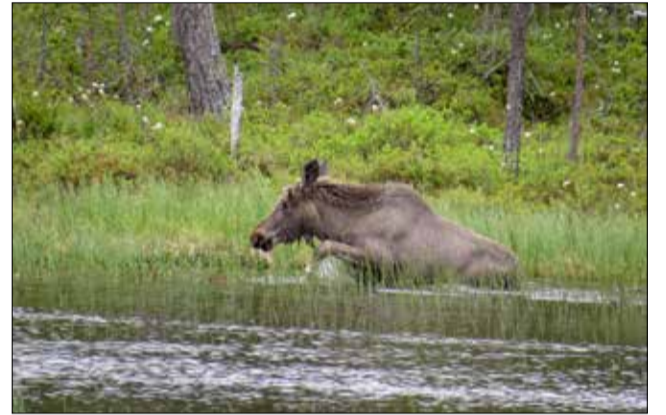
Hirvi vierailee aamu- ja iltapäivisin niityllä ruokailemassa.