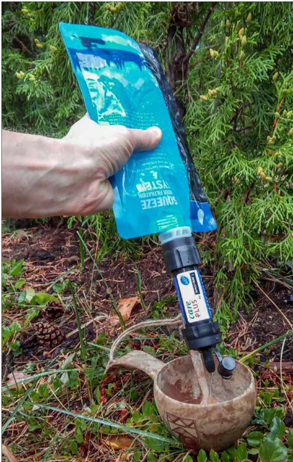
Kuvan vedensuodatin painaa 65 grammaa ja suodattaa 1,7 litraa vettä minuutissa.