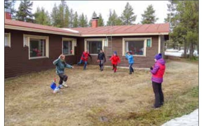
Susikupin tehtävät olivat enimmäkseen liikunnallisia.