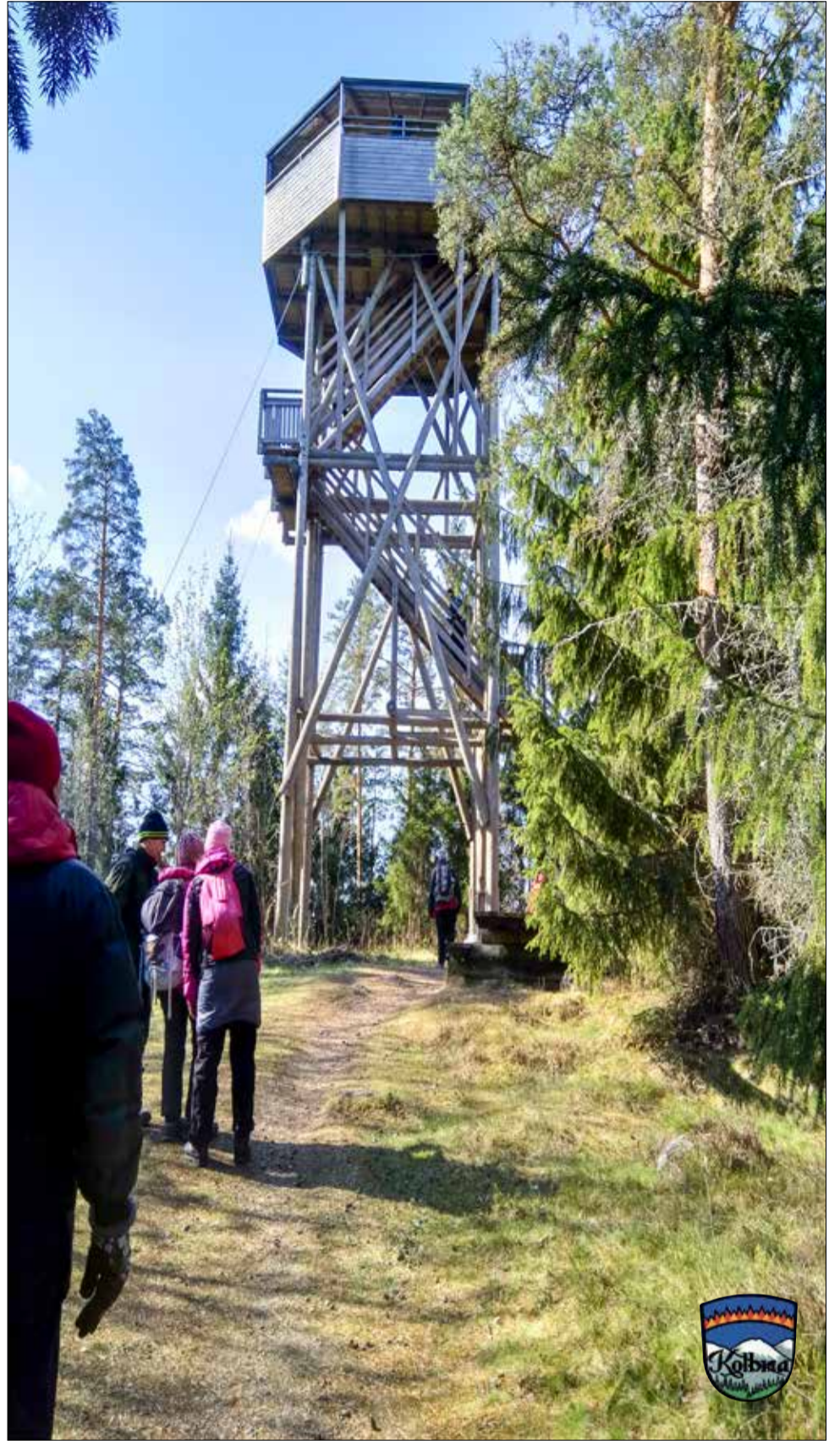
Kärjenkallion lintutorni on kunnioittavan kokoinen. Sieltä aukeaa näkymä Puurijärvelle.