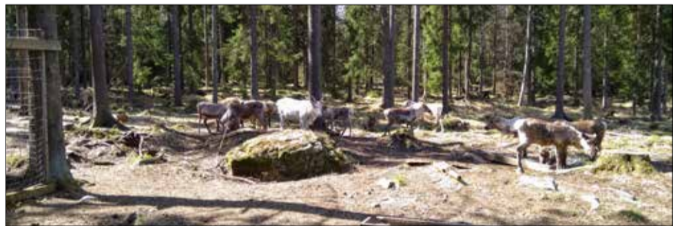
Poroja löytyy myös Satakunnasta Kriivarin porotilalta..