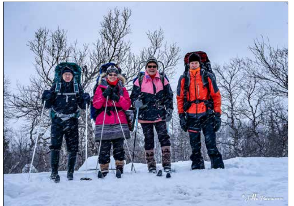
Hiihtäjät lähössä Hannukurusta Susikyrröön.