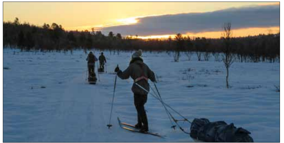
”Aikaset hiihtäjät hankinnon löytävät.”