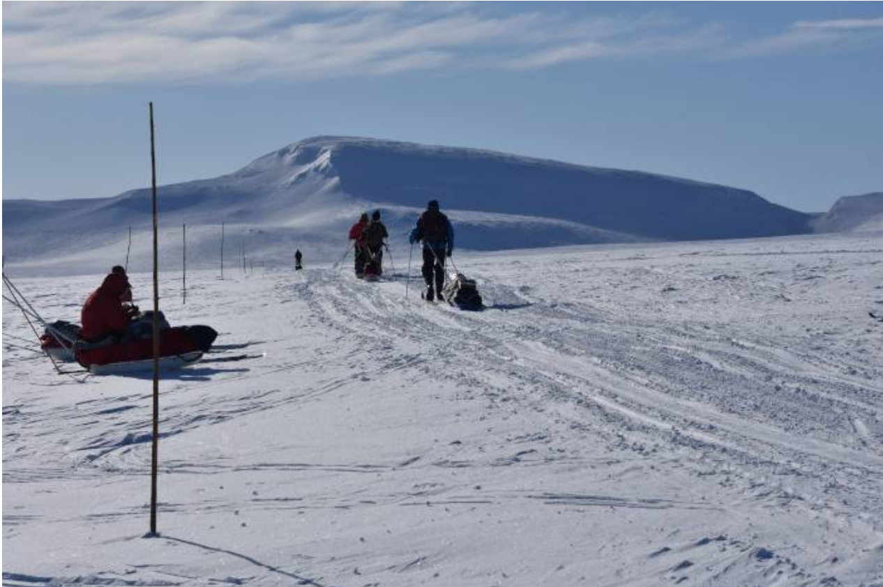
Matkalla kohti Kuonjarjokea

Torstai 8.4 ilman kirkastuttua edellisenä iltapäivänä saimme nauttia koko päivän auringosta. Aurinkorasvaa 50% joka tauolla ja silti naama punotti. Aurinko myös lämmitti ilmaa niin, että luovuin kuoriasusta ja hiihtelin merinovillakerrastossa. Pidimme lounastauon Meekon varaustuvan edessä. Paljon rauhallisempi paikka, kun moottorikelkat kurvailivat vain autiotuvan edestä. Muutama ehti löytää geokätkönkin pihapiiristä sekä nautittiin auringosta, yksi bongasi kärpäsenkin tuvan eteläseinustalla. Matka jatkui kohti Kuonnarjoen autiotupaa. Illemmalla aurinko vielä paistoi, mutta ilmassa tunsu tulevan yön viileyden, teltoja päästiin kasaamaan vasta n. klo 19.00. Viikon kylmin yö -15 astetta.