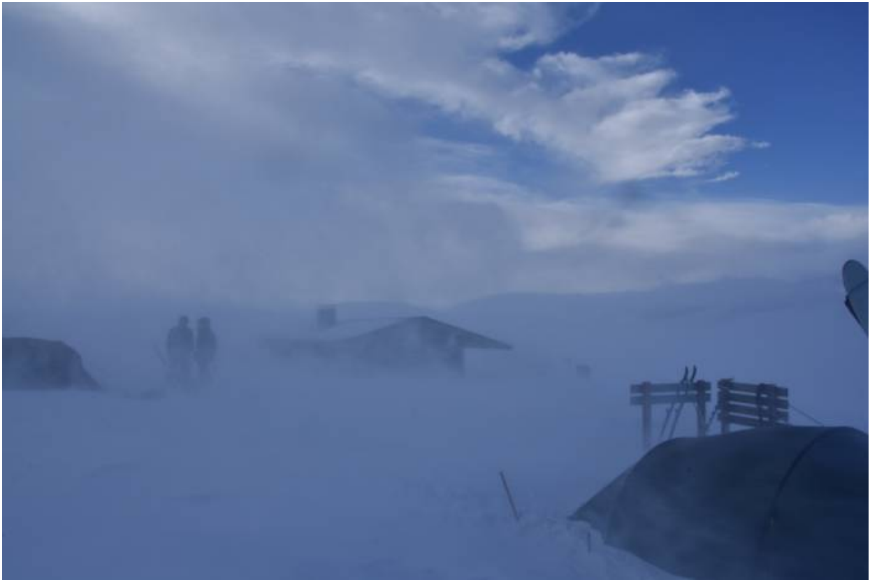
Pihtsusjärvi aamulla, lähtö Haltille