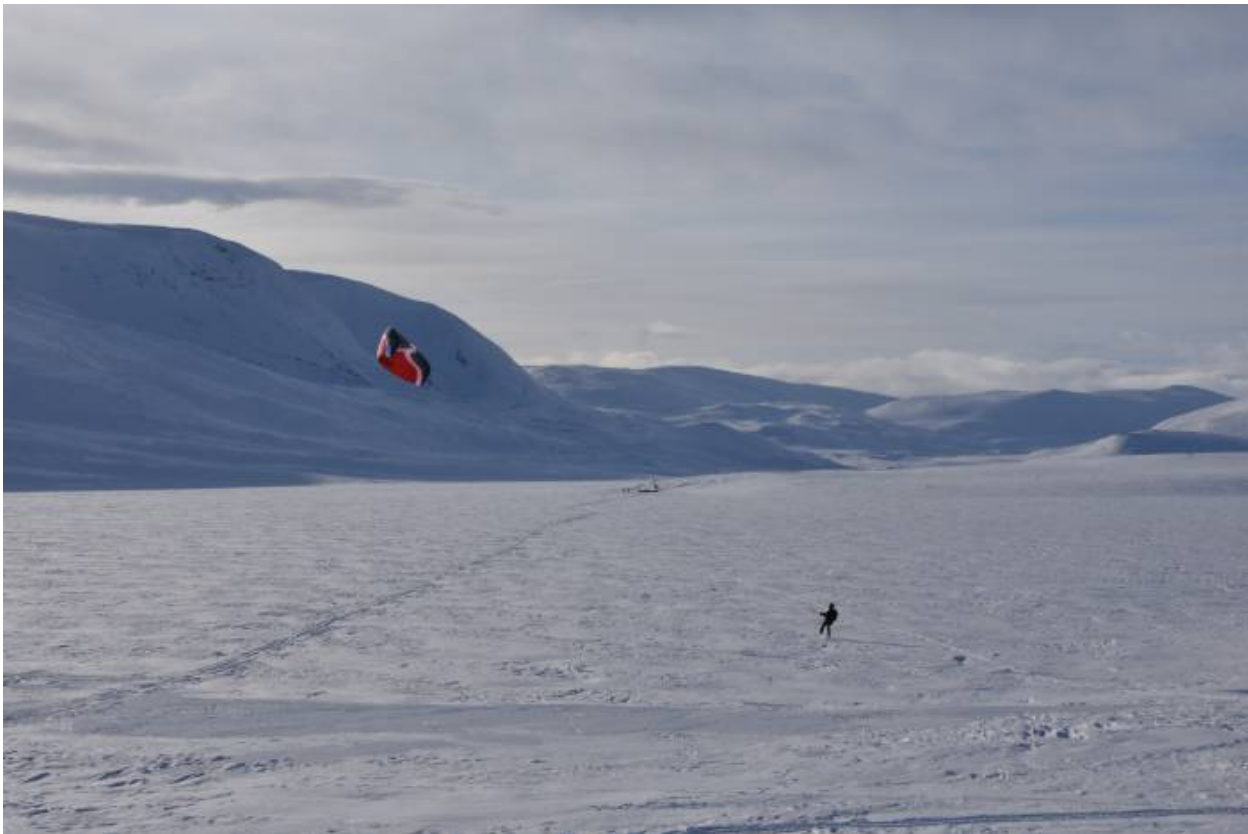
Pihtsusjärvi samana iltana