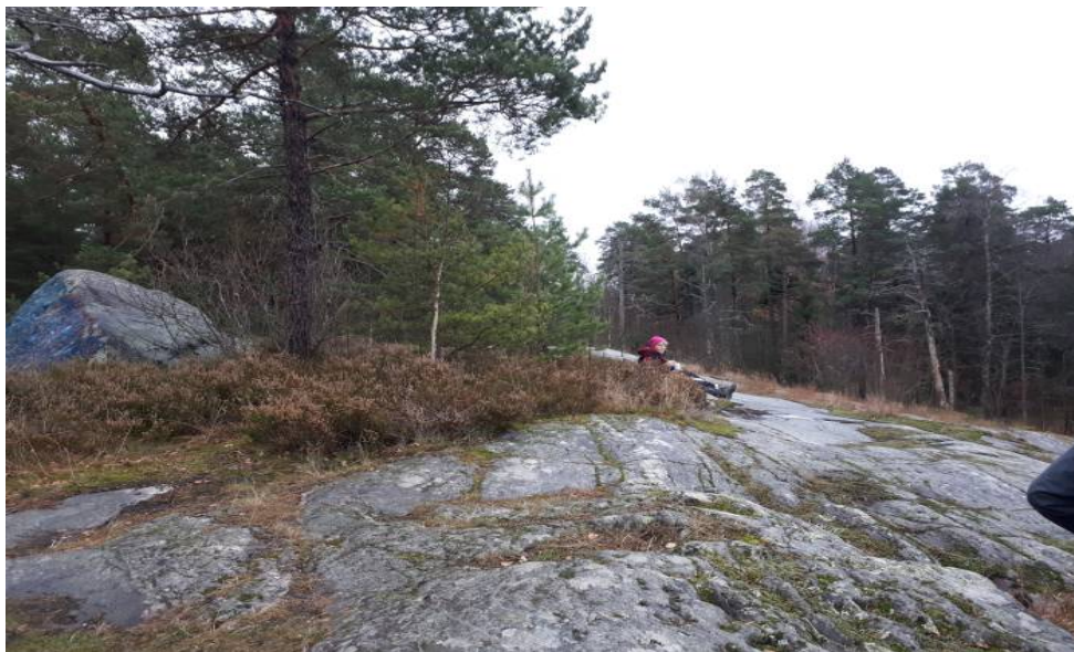
Puolipitkä marssi Laajasaloon 2019

Lokakuun lopussa on perinteinen puolipitkä marssi, eli kävelemme noin 20 km päivämatkan. Marssi toteutetaan lauantaina 23.10. tai 31.10. Mahdollisia hyviä reittiehdotuksia voi esittää tiedottajalle.