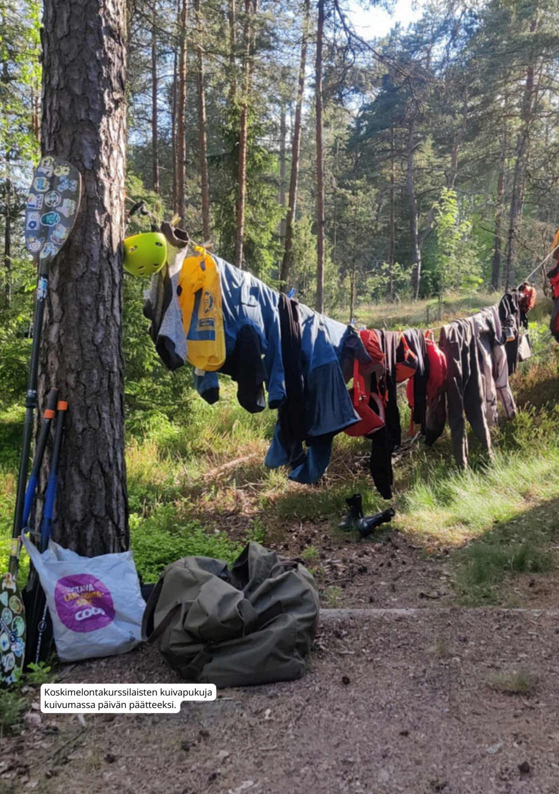
Koskimelontakurssilaisten kuivapukuja kuivumassa päivän päätteeksi.