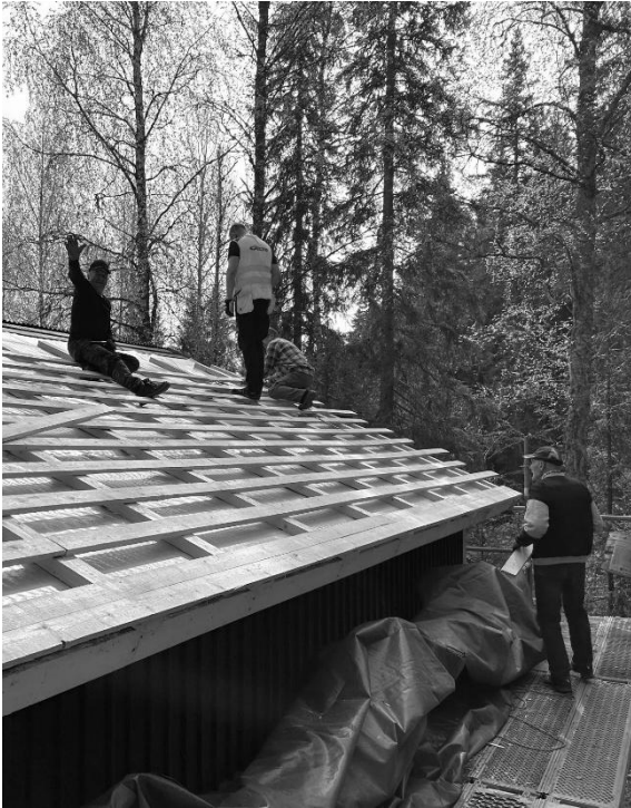
Aluslaudoitus uusittiin ...