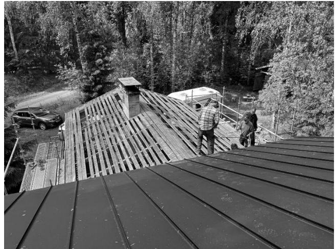
... myös saunan puolelle