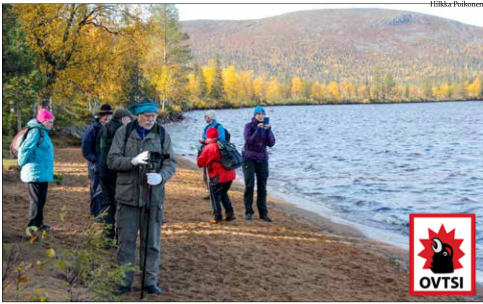
Pallasjärven Punainenhiekkä oli kokemisen arvoisen.