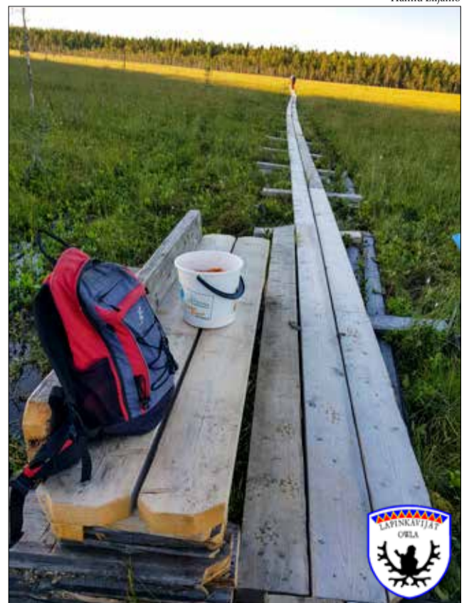
Uusittu Martimoaavan Järvireitti.