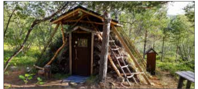
Pekan-Kammissa katto on nyt aiempaa korkeammalla.

Kannattaa myös pitää yhteyttä paikallisiin ihmisiin (tärkeä asia suhdetoiminnan