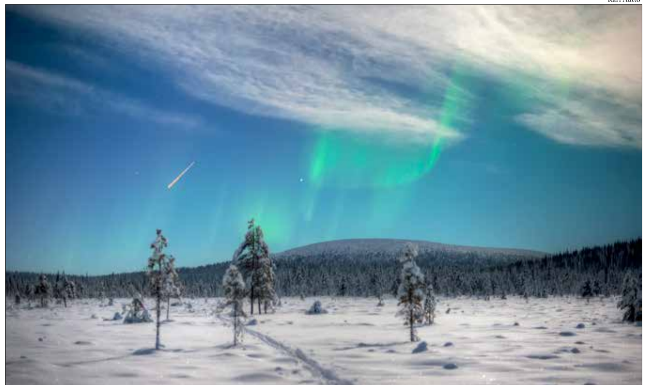
Ounastunturien maisemat ovat tuttuja ja rakkaita monelle tunturilatulaiselle.