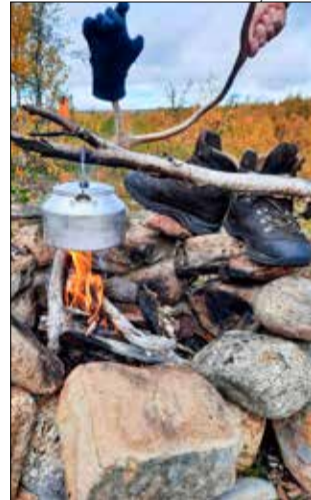
Nuotio oli tarpeen.