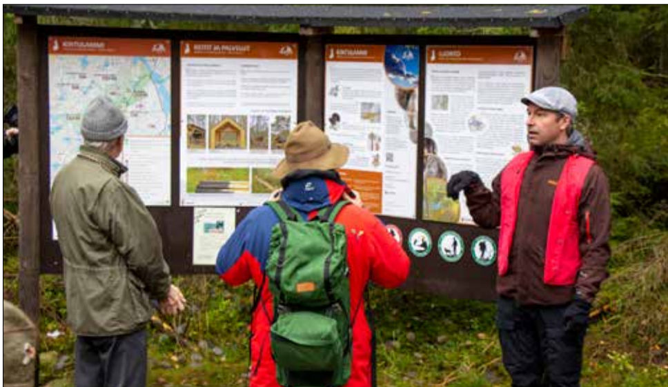
Kolbman Pete Mäkelä opasti tunturilatulaisia Kintulamilla.