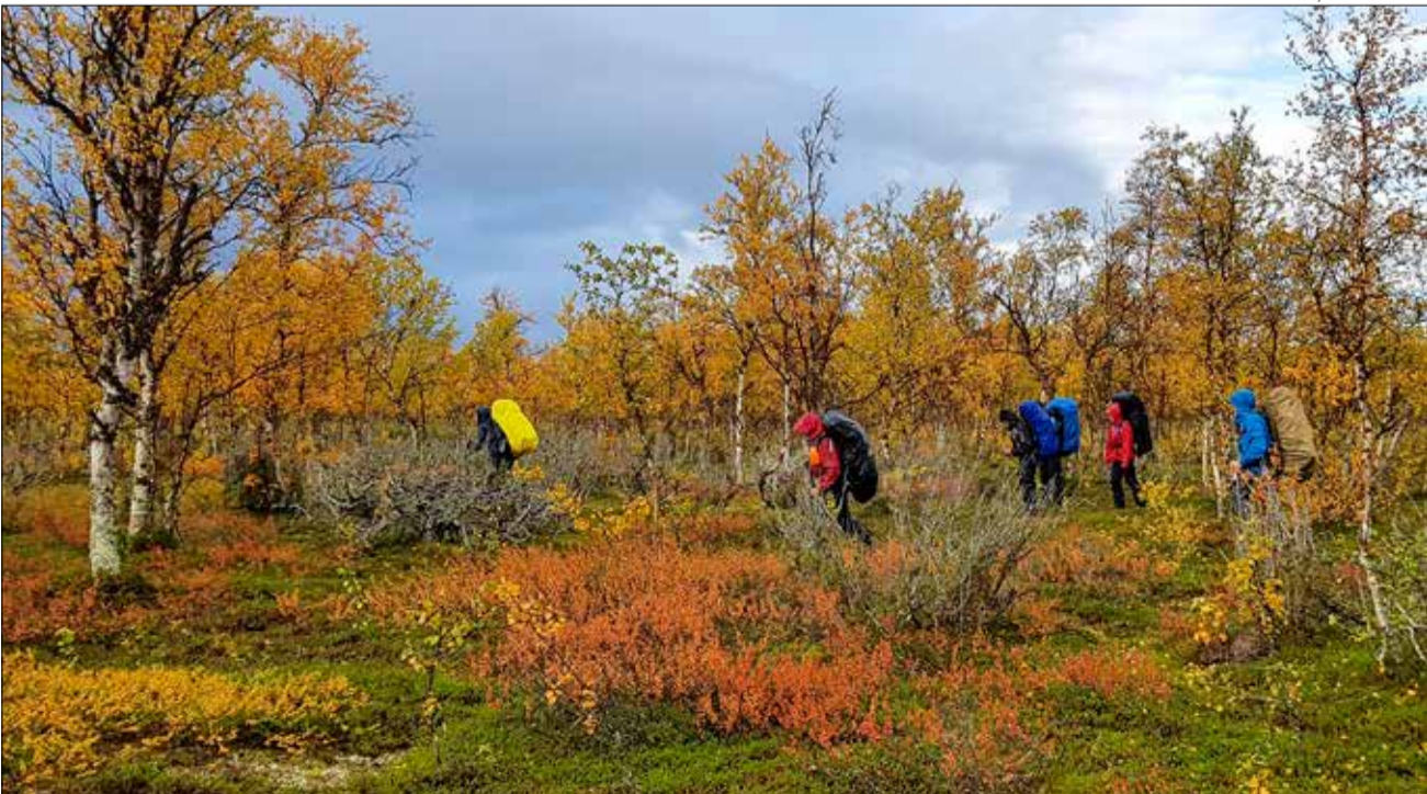
Koivikon kultaama kulku.