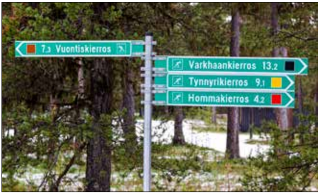
Näitä reittejä olisi kiva kulkea kesälläkin, mutta jospa tulevaisuudessa se olisi mahdollista.