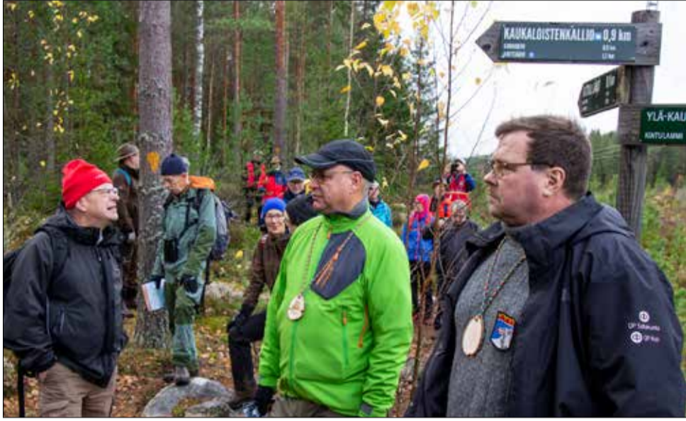
Kintulammin alue kiinnostoi tunturilatulaisia.