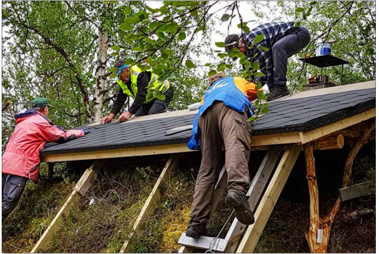
Pekan-Kammi sai uuden vesikaton.

Kiisalla (mukana 5-7 henkilöä) viikolla 33 oli tehtävänä kaikki samat kiinteistöjen huoltoon ja rakennusten kunnossapitoon ynnä siivoukseen ja polttopuihin liittyvät työt. Lisäksi käyttäjien tekemän huomion johdosta jouduttiin