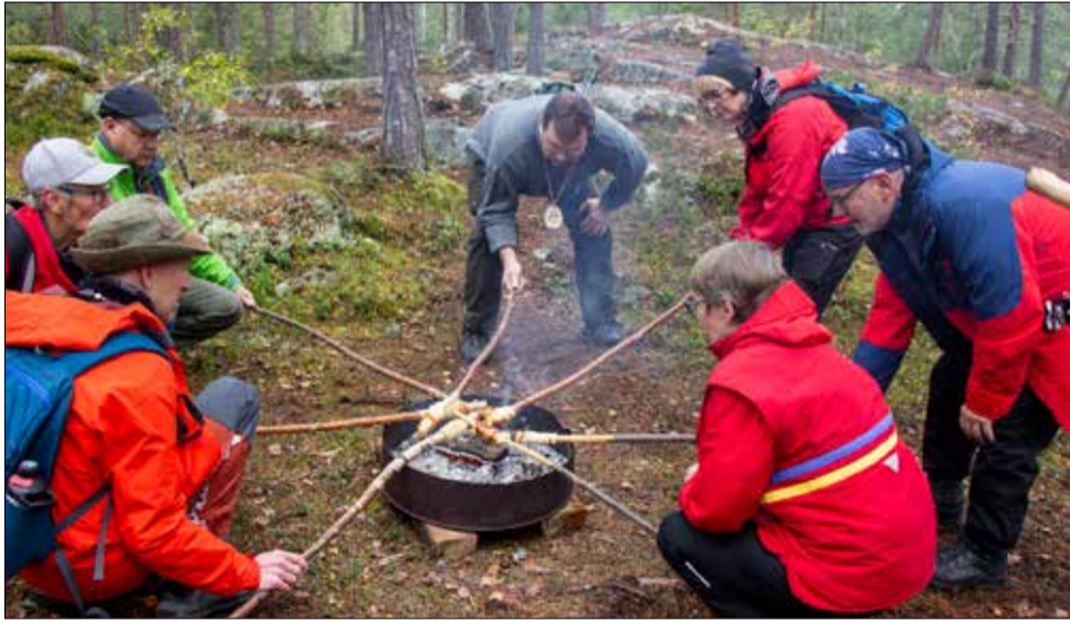
Nälkä ei päässyt Kintulamilla yllättämään.