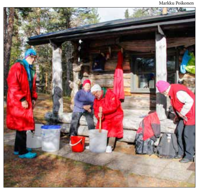
Kaarnikkamehua syntyi runsaasti.