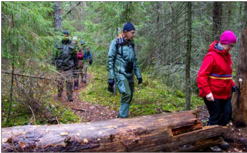
Suurin osa susiaisväestä kiersi noin neljän kilometrin mittaisen lenkin.