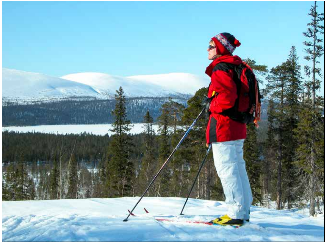
Raattaman Reittien ylläpitämät ladut ja Pallaksen maisemat ovat tunturilatulaisille tuttuja.

Toukokuussa 2019 Raattaman Reiteille on valmistunut tampparitalli lähelle Susikyryntietä. Tallissa säilytetään ja huolletaan Raattaman Reittien latukonetta. Tilikausi Raattaman Reiteillä oli