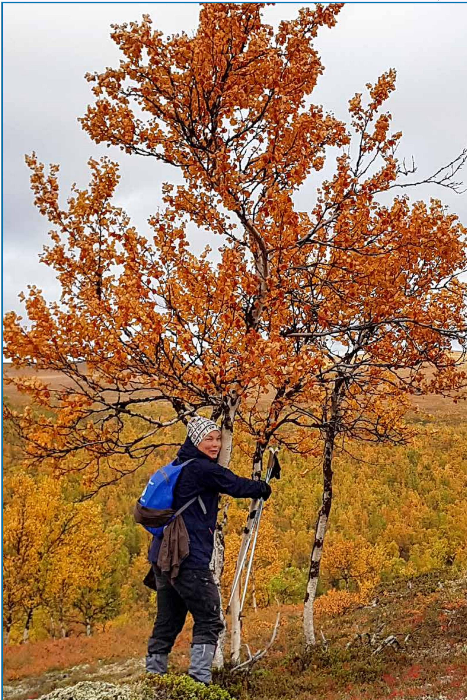
Tsietsan ruskavaellus toteutettiin juuri oikeaan aikaan.