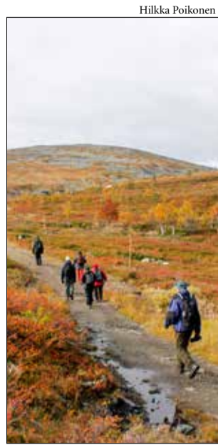
Montellin maja kutsuu.