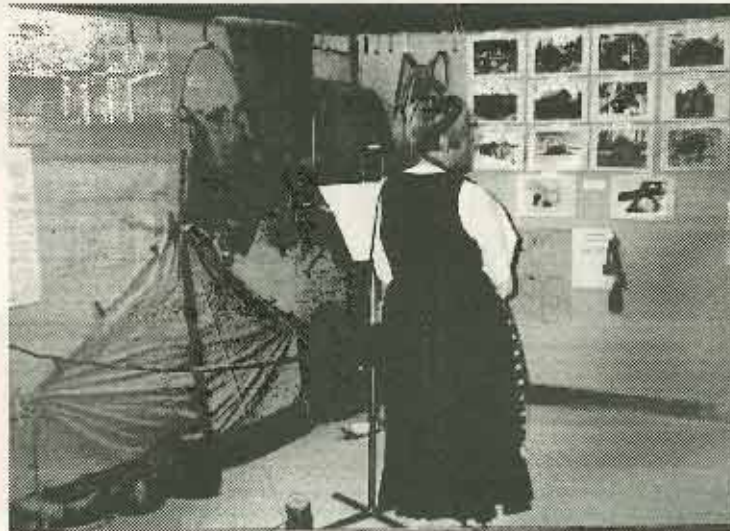
Nostalgianurkassa toivat vanhat retkeilyvälineet, kartat ja kadonneiden kämppien valokuvat monelle mieleen haikaita muistoja.