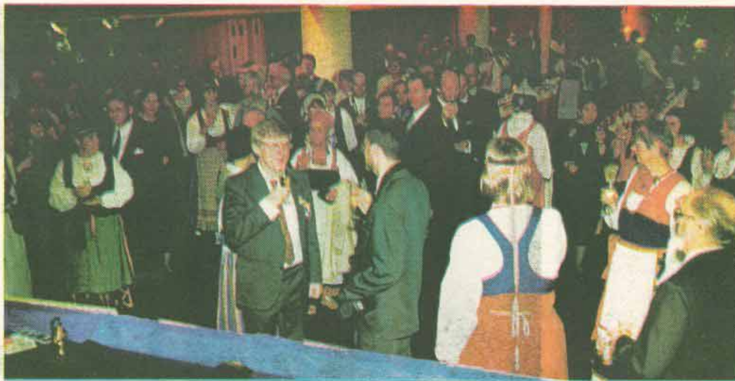
Malja 50-vuotiaalle Tunturiladulle 300:n juhluvieraan voimin!

joka oli ollut mukana jo perustavassa kokouksessa Puotilan kartanossa.