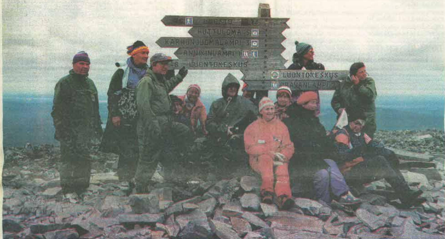
Kumpelaiset Pelkosenniemen Pyhätunturin Seitakeron huipulla 10.09.1996.