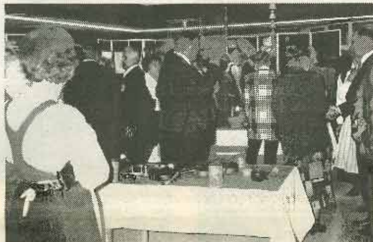
Harrastusnäyttely herätti erittäin vilkasta mielenkiintoa. Olipa aihehtakin.