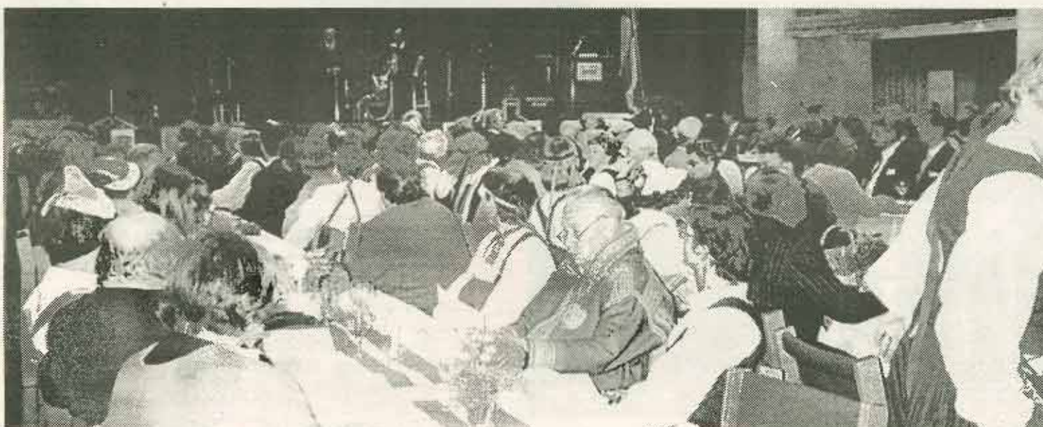
Suuri sali oli ääriään myöten täynnä juhlijoita.