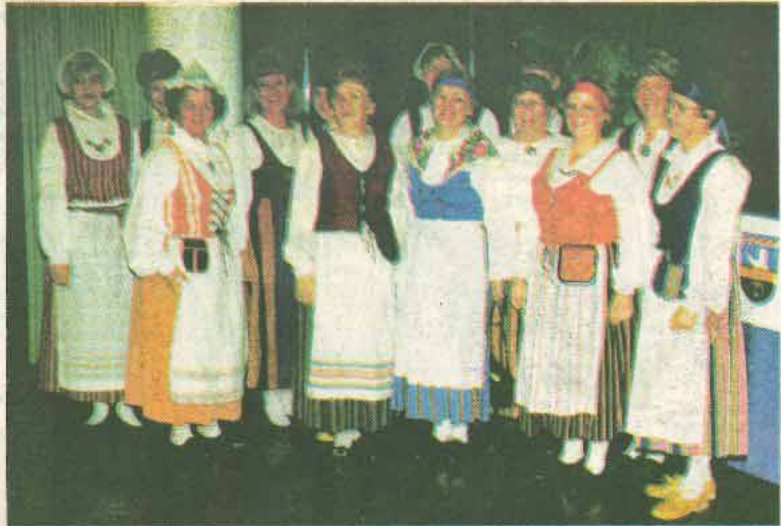
Login edustava kansallispukuinen naisjoukkue juhlapöytänsä.