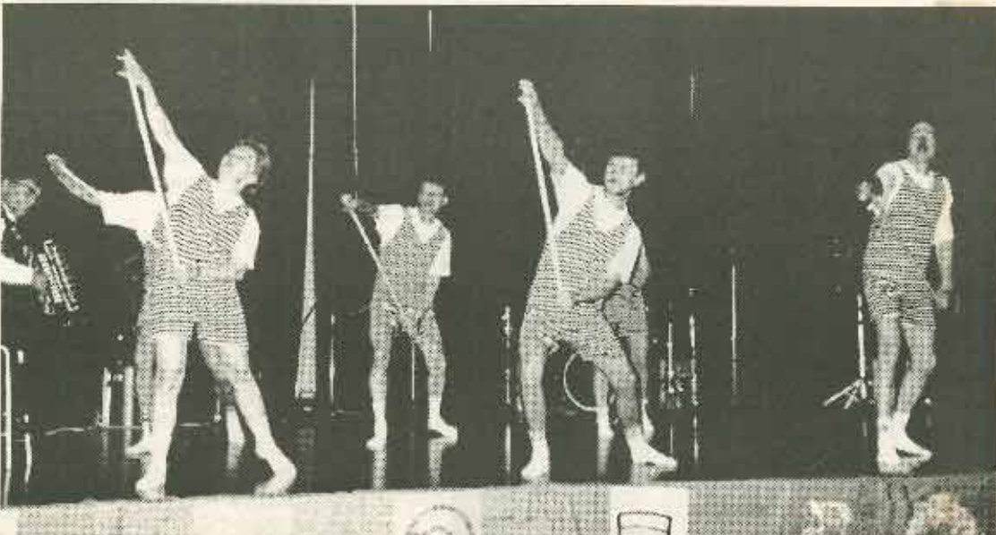
Tästä ei estradiviihde enää parane. Logilaisten keppivoimisteluesitys.