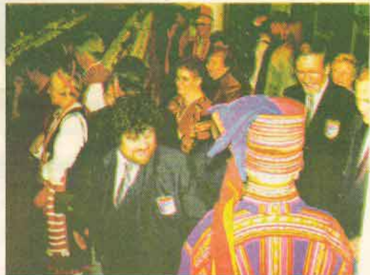
Juhlijoiden iloisen värikästä joukkoa.

Tästä 76 puvun 'dokumentoidusta' otoksesta hiukan yhteenvetotietoa. Joukko koostui 43 eri puvusta, joista kahdeksaa kantoi mies. Alueellisesti oli eniten Karjalan pukuja, peräti 31, sitten savolaisia (10) hämäläisiä ja pohjalaisia, kumpiakkin 8. Suurinta suosiota nautti Ylä-Savon puku, 8 kappaletta. Kaukolan puku oli kuudella juhlijalla, Etelä-Pohjanmaan neljällä samoin kuin Tuuterin ja Sakkola-Raudun puvutkin. Pohjoisin oli peräisin Karasuvannosta, läntisin Teuvalta, eteläisin Inkerinmaalta Tuuterista. Itäisin oli ilmeisesti Pyhäjärven