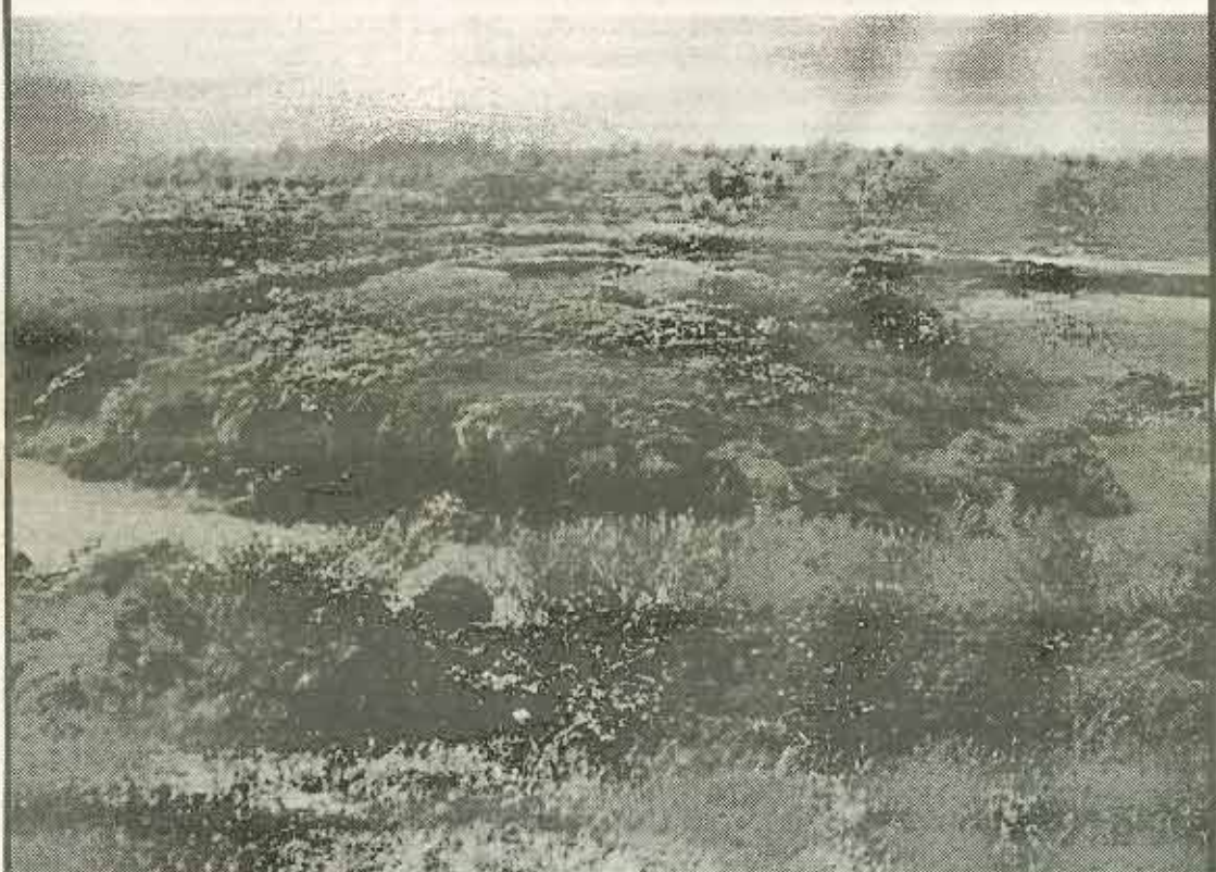
Noin puolitoista metriä korkea palsa Kevon luonnonpuistossa Savdsajavrin suoalueella on jo alkanut sortua laidoiltaan.

Moni kulkija on Lapin tunturien laaksoissa tavannut outoja kumpuja, joita usein ympäröi vallihaudanomaisesti vesirengas. Suomessa näihin "kumpuihin" eli palsoihin voi törmätä ainoastaan Enontekiön ja Utsjoen sekä Inarin tunturien suo-laaksoissa. Maailmalla palsat ovat pohjoisen palonpuoliskon ilmentymiä kuten jääkarhutkin. Suota, jolla on palsoja, sanotaan palsasuoksi.