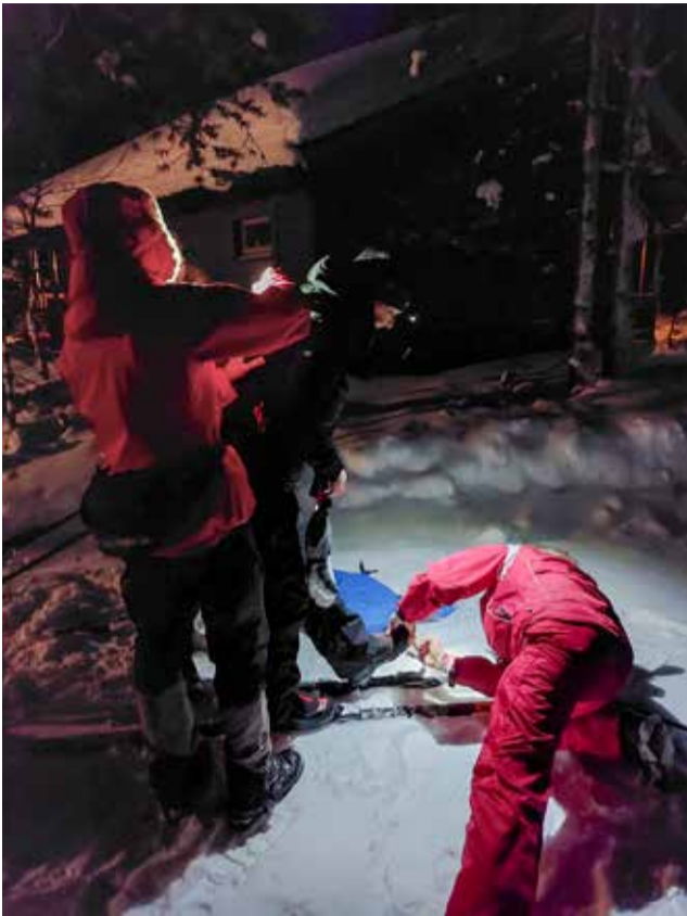
Susikyrröstä lähdössä aamuhämärässä.