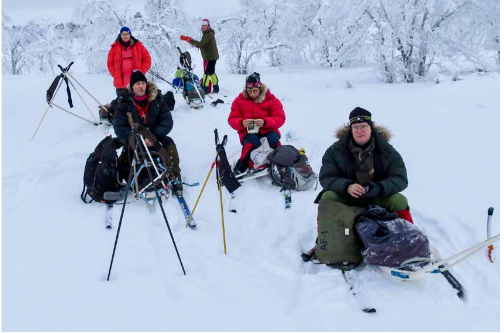
Taukoja pidettiin tunnin välein.

Tuvalle saavuttiin pimeässä kuten muinakin iltoina päivän valon yltäessä noin puoli neljään asti. Aamun hämärissä yhdeksän jälkeen jatkoimme pikku järviä ja soita pitkin kohti Valkamavuomaa, jossa vaihtelun vuoksi saimme teltailla, sillä haviteltu tupa ei ollut tarjolla. Pieni tuuli lepatteli telttaa, mutta pakkasesta käväistä 10-asteen lämpimämmällä puolella.