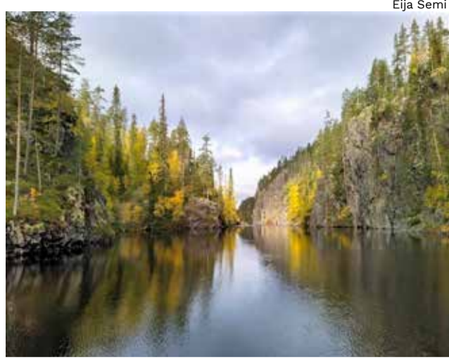
Julma-Ölkky veneestä nähtynä.

jantain kohde oli Julma-Ölkky, joka on suurin kolmesta Suomessa olevasta maan halkeamaan syntyneestä kanjonijärvestä.