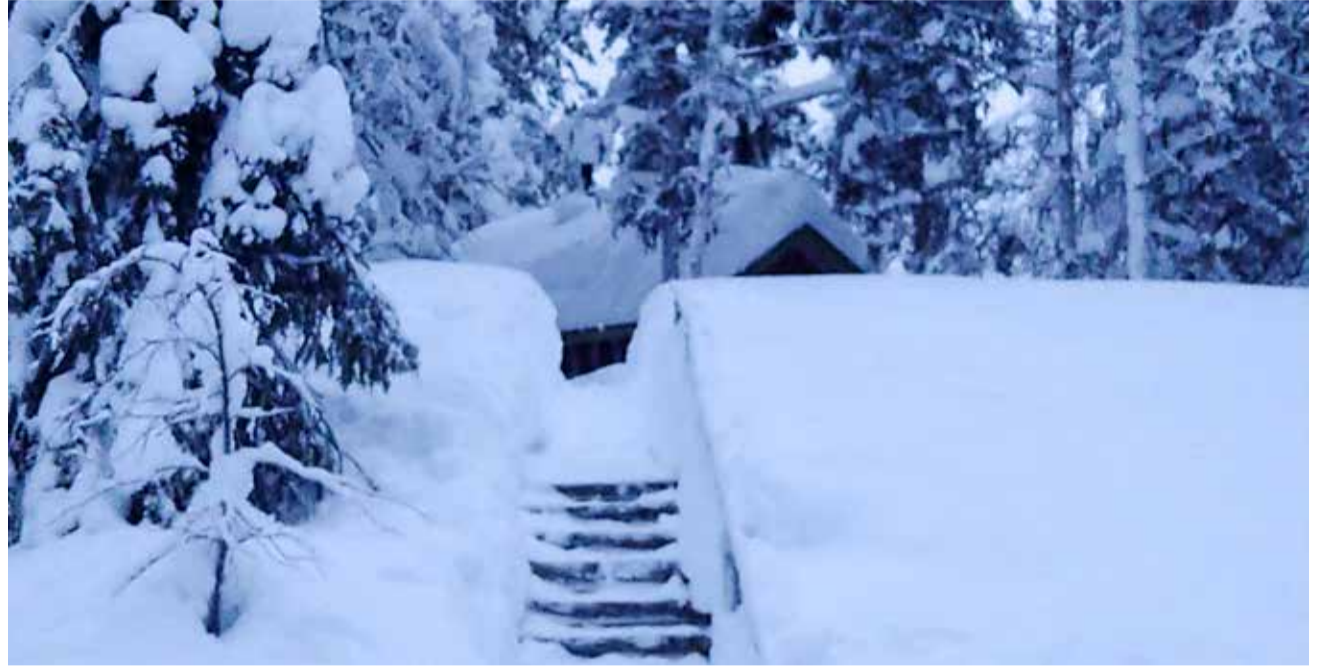
Aihkiin johtavat portaat ovat paksun lumipeitteen ympäröiminä.

Tämä kevätkausi on taas haasteellinen kattojen lumikuormalle ja sen pudottamiselle. Vuosikymmeniä kämp-