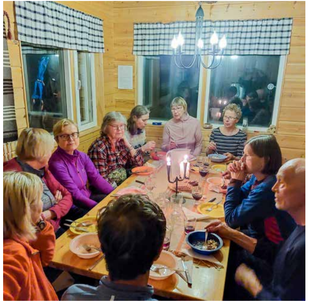
Reissun päätteeksi kokoontuimme yhteiselle aterialle Pekan-Oskariin.