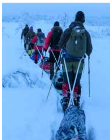
Vuosi vaihtui Pöyrisjärvellä