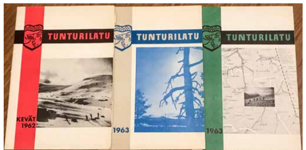
Kolme ensimmäistä Tunturilatun lehteä. 1962 ilmestyi yksi lehti, 1963 kaksi numeroa.