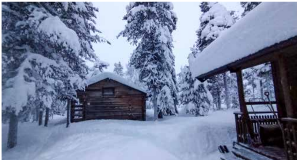
Kämppien katoille kertyy talvella melkoinen lumitaakka, jota on siitä syytä sieltä poistaa.