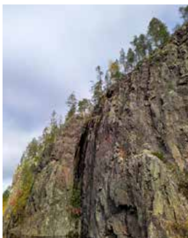
Kumpe retkeili Hossassa