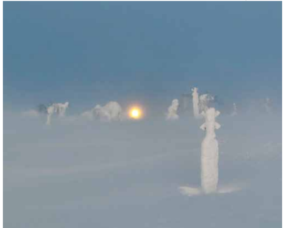
Kohti kuuta ja Montellia vastatulessa.