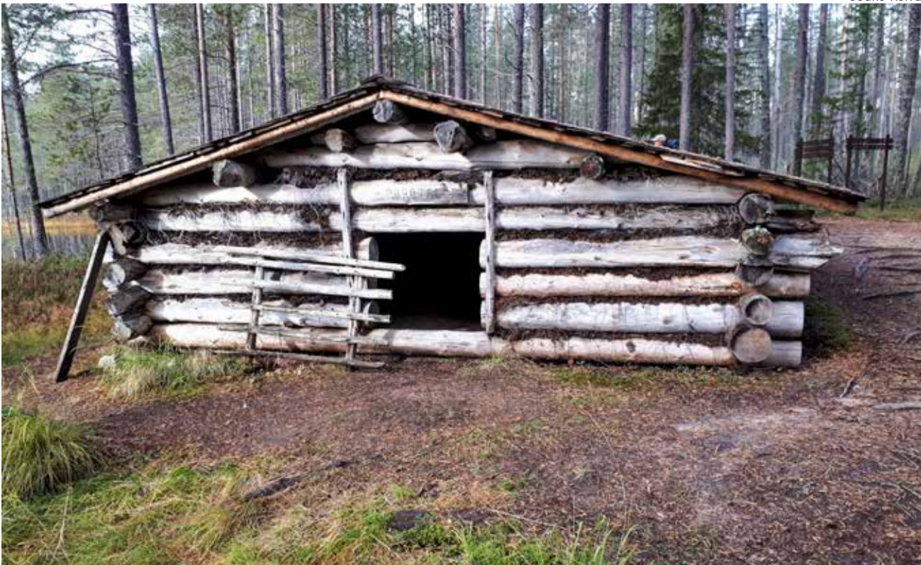
Porotallo oli muinoin tärkeä rakennus.