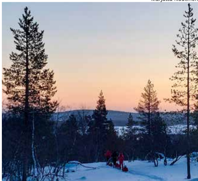
Matkalla kohti Ketomellaa.

Retken vetäjän näkökulmasta haasteellisin hetki ja päätös täytyi tehdä seuraavan yön aikana; jatkaako matkaa Saivokurun satulan yli Montellille ja siitä ainakin Suaskuruun, vai palata Susikyrröön. Tuulta oli aamupäivällä luvassa 10 metriä sekunnissa, ja suunta vastainen, puuskissa liki 20 metriä. Seuraavakin päivä olisi tuulinen ja tuiskuinen, aamulla tosin korkeintaan 7 metriä sekunnissa.