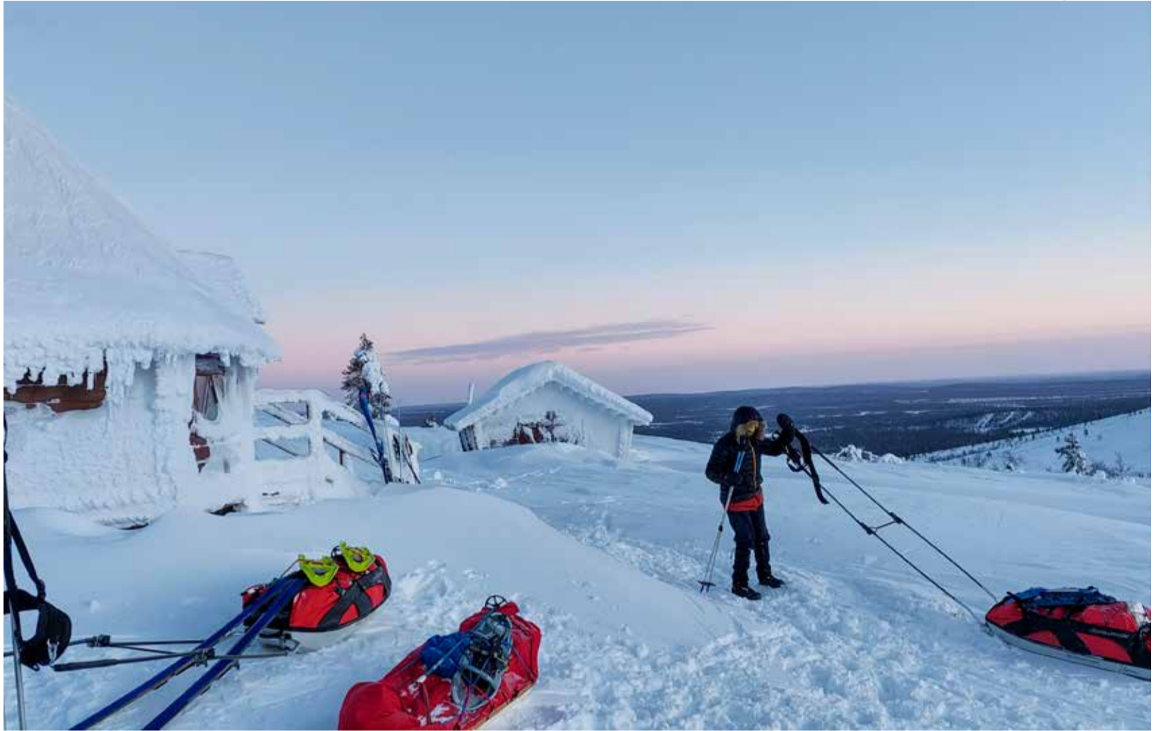
Montellin uudella kodalla pidimme kunnon tauon.