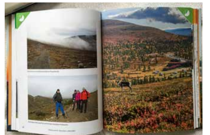
Retkeilijän oppaassa on runsaasti kuvia eri tuntureilta.