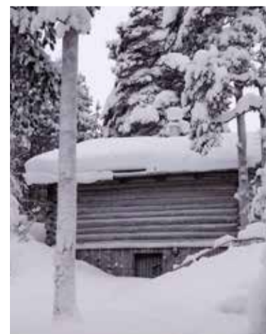
Kämpillä puuhaa talvellakin