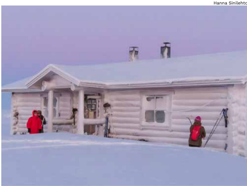
Kuuran peittämä Pöyrisjärven kämppä.

Vuoden vaihteen yöni jälkeen oli korjaussuunnitelma kirkastunut, ja alumiiniset telttakiilat työstettiin levyiksi, jotka pitivätkin suksen kasassa. Kirkkaassa päivänvalossa teimme tiedusteluretken seuraavaa päivää varten ja juhlimme alka-