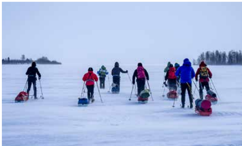
Owlan vuoteen mahtuu retkiä lähellä ja kauempanakin