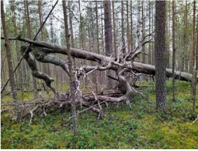
Ikimetsä juoksee pakoon ihmistä.

vikautiset kuvat on maalattu käyttäen puna- ja keltamultaa, jota on saatu kuumentamalla rautapitoista savea. Siihen seosaineeksi on lisätty verta, rasvaa ja mahdollisesti munankeltuaista.