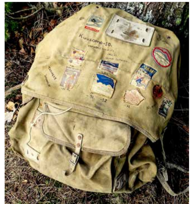
Tahkon satulareppu on merkien perusteella nähnyt paljon maailmaa.

Lähteet. Kalle Virtapohja: Lauri Pihkala- koko kansan Tahko . 2022 Docendo