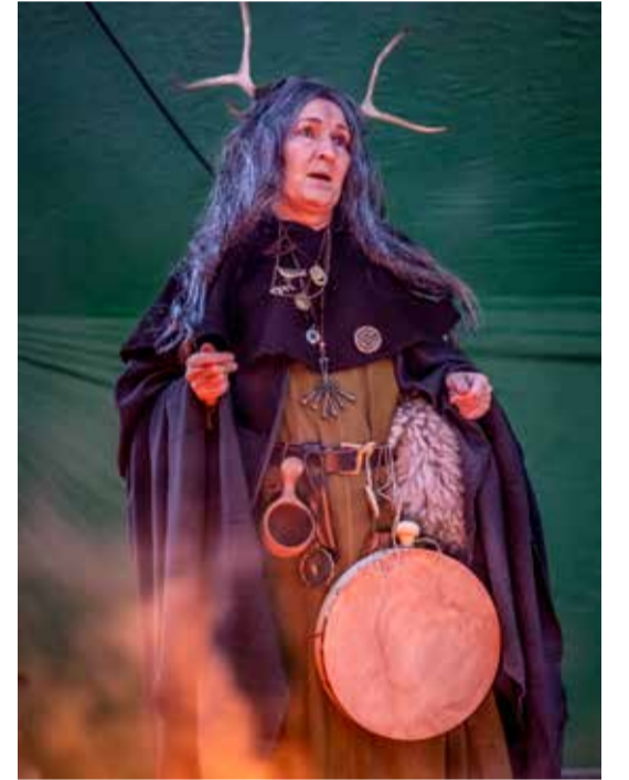
Rakkakolun noita hoiti tehtävänsä mallikkaasti susiaisissa.

50-vuotisjuhlaviestissä tunturilatulaiset hiihtivät osuuden Nuorgam – Kiilopää.