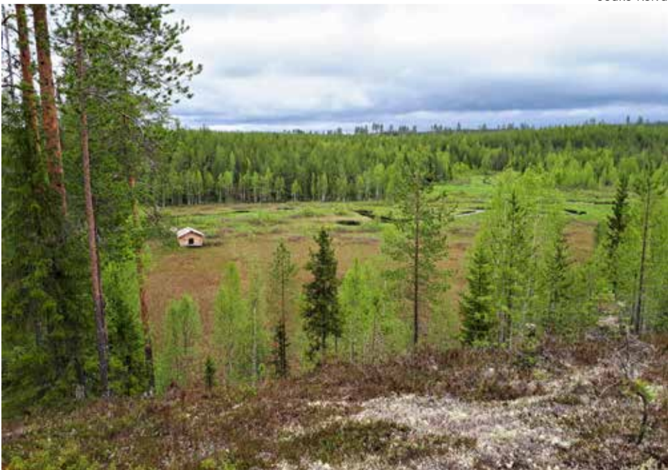
Porrasjoen rantaniittyä Tornionsärkältä kuvattuna.