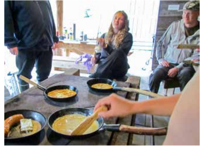
Ruokailukatoksessa paistuivat letut hienosti.