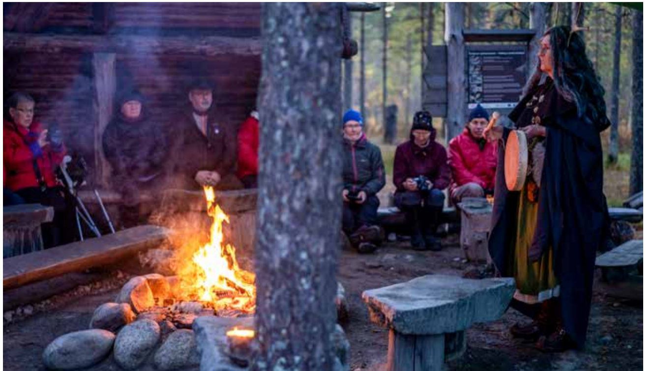
Susiaiset Kierikin kivikauden kylässä illan hämärtyessä.

Muutamin sanoi Rakkakolun noita kertoi Tunturiladun susien merkityksestä ja luonnosta sekä kysyi onko paikal-