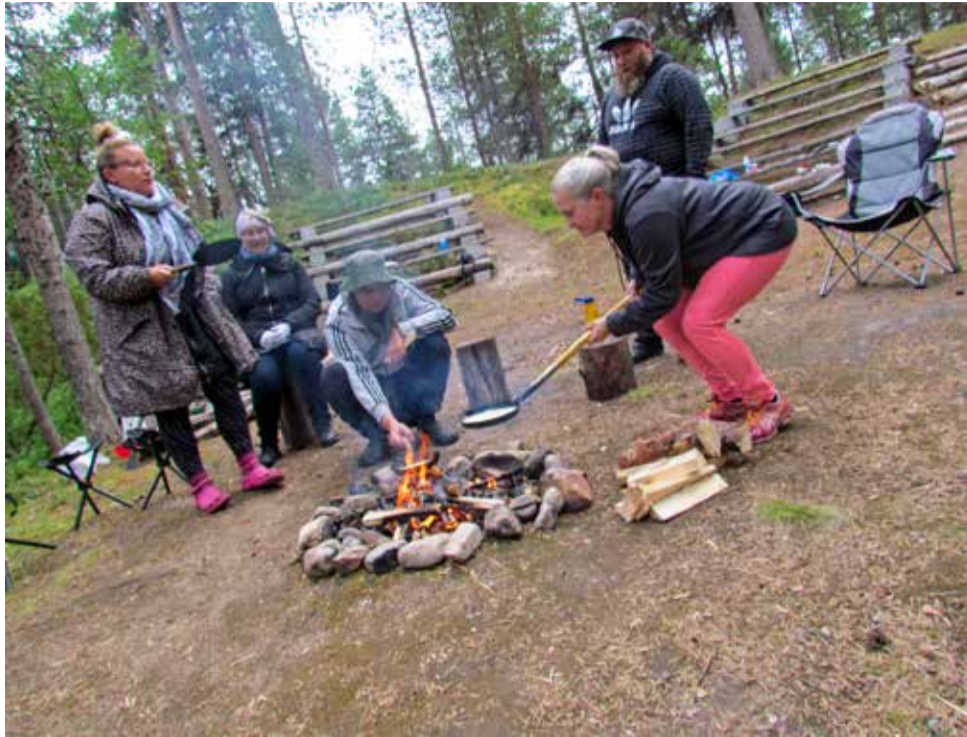
Mintun näkemys lettujenpaistosta.

Yksi syy yhdessäolomme Susikyrossä oli viime jouluna kaikille antamani lahjakortti Susikyrossä annettavasta le-tuntekemisen ja -heittämisestä. Koulutuksen ja letun kääntämisen ilmaan