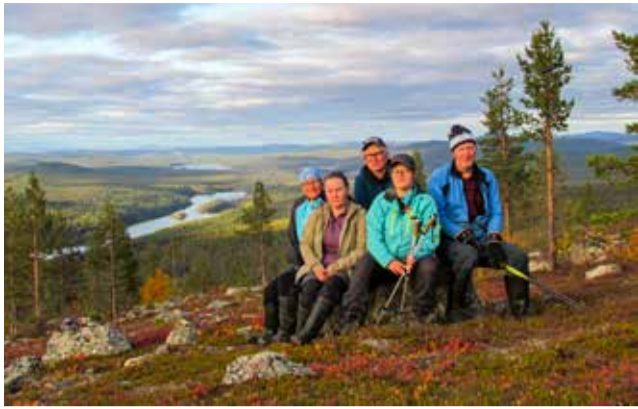
Lemmenjoen avaraa maisemaa Joenkieliseltä katsottuna.

tämiä luontoon liittyviä runoja, jotka he olivat valinneet esitettäväksi runoon liittyvän maaston kohdalla. Seikkailijat olivat myös saaneet etukäiteistettäviä, jotka liittyivät kansallispuiston luontoon, eläimiin, kasveihin ja kulttuuriin, näitäkin esityksiä kuultiin matkan varrella. Heitä ”työllisti” myös pareittain tehtävä kunkin vaelluspäivän tapahtumien kirjaiminen yhteiseen retkimis-