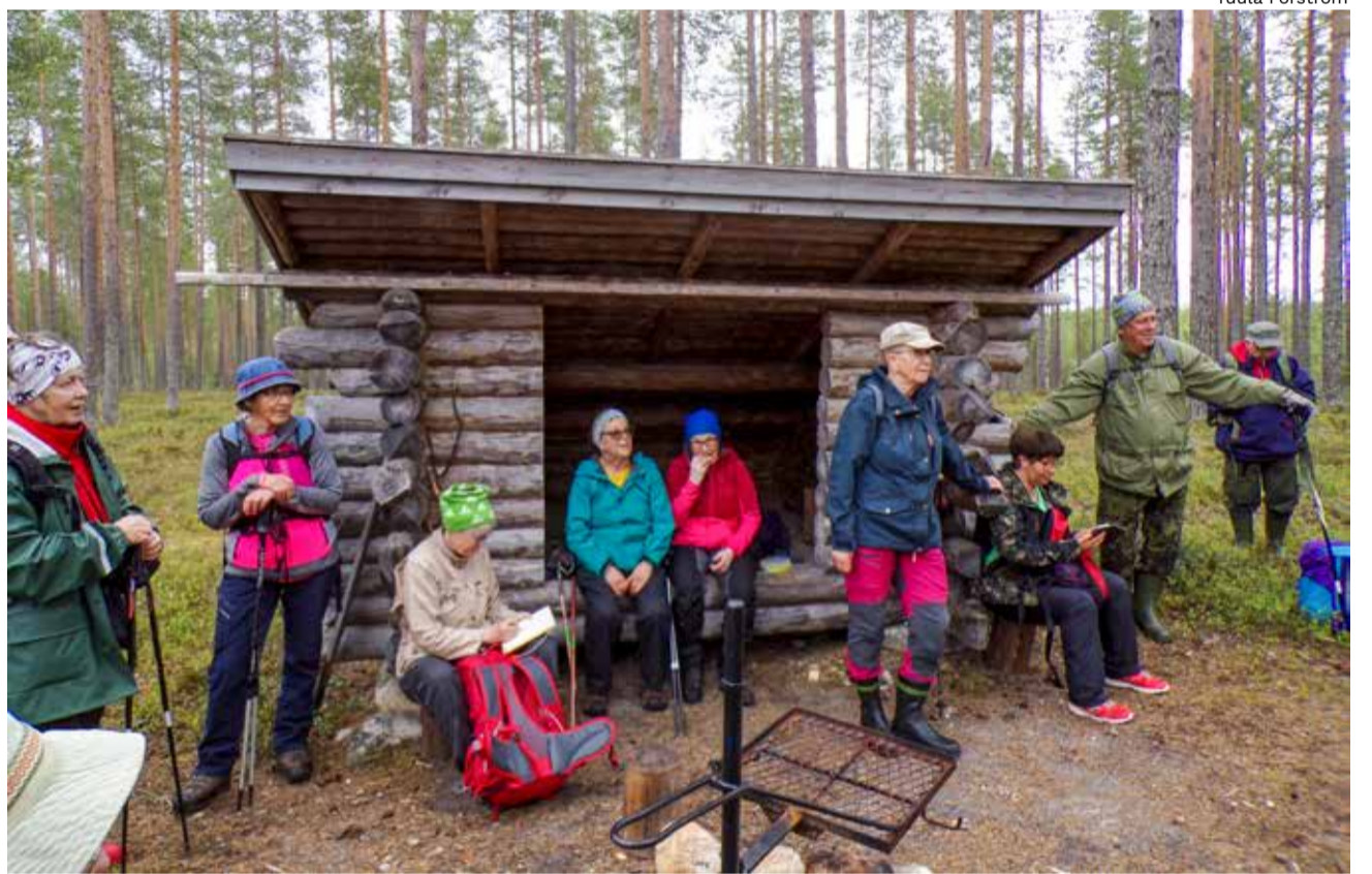
Jumalanhyväahon laavulla pidettiin tauko.