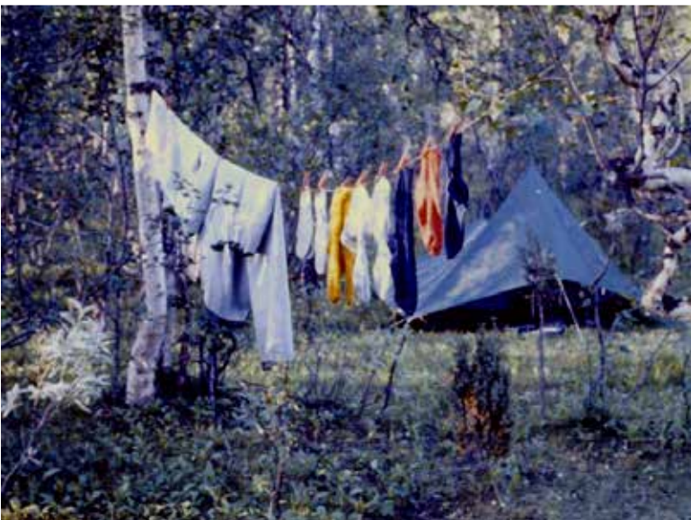
Leiri Pöyrisjoen rannalla.