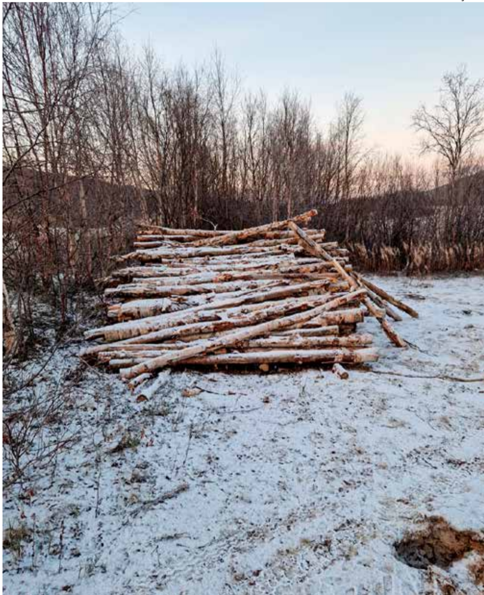
Ensilumi satoi Tenojokivarteen 21. lokakuuta. Niinpä poltopuiden siirto Susi-Kiisalle jäi ensivuoteen.