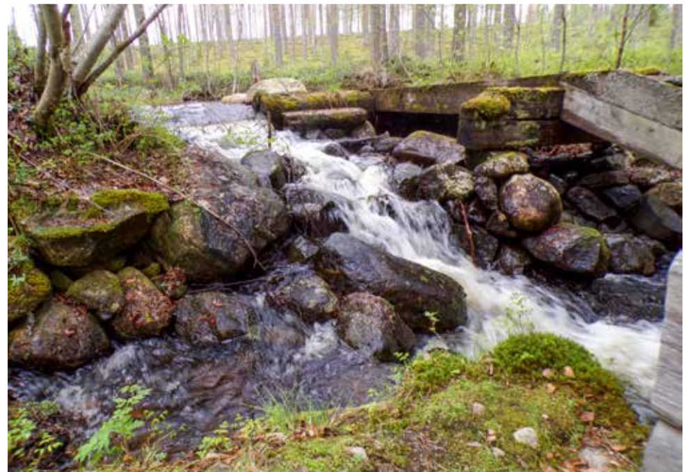
Rautiaisen myllyn kosken kuohuntaa.