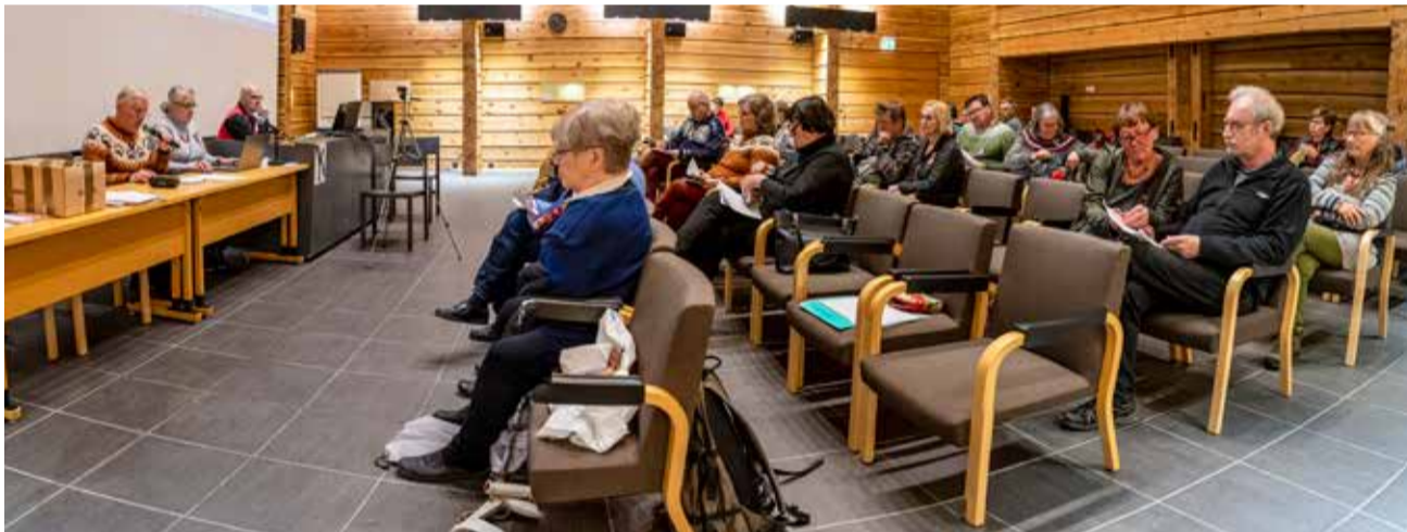
Kokousväki päätti Tunturiladun tulevasta vuodesta yksimielisesti.