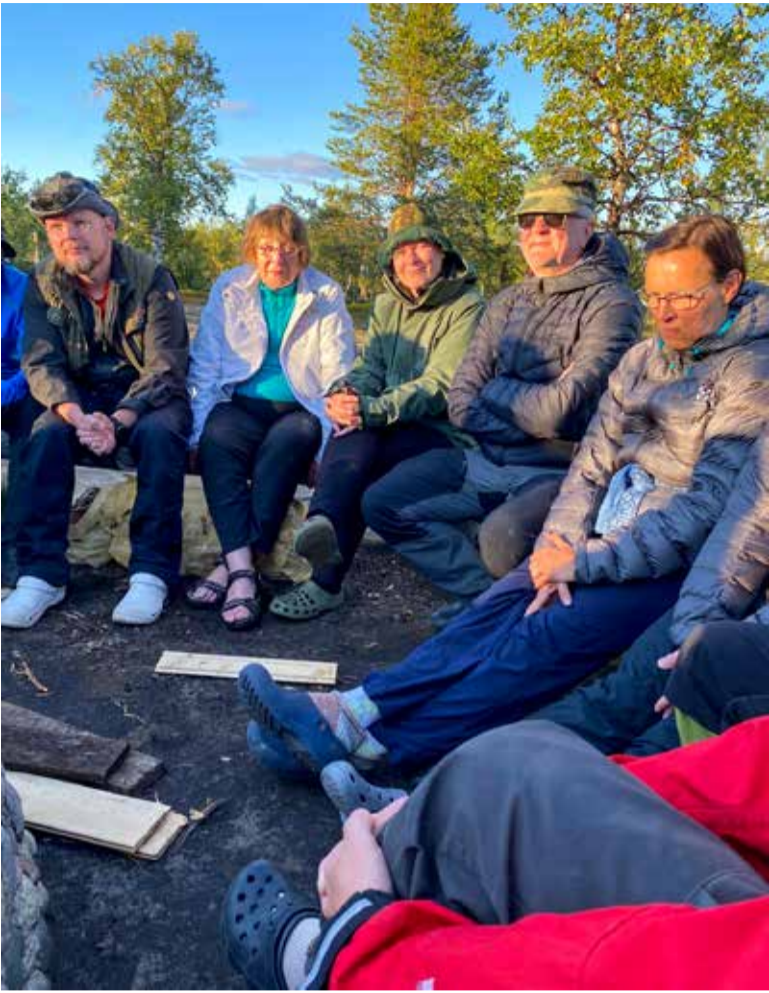
Ensimmäisissä kuruiltamissa väki viihtyi.

kemattomiksi laskimme, joill3 tämä oli ensimmäinen pitkä vaellus. Tämä ryhmä luo myös uutta vaelluskulttuuria, joten roskaton kansallispuisto sopii hyvin heidän ajatusmaailmaansa. Kokeneita oli 97.