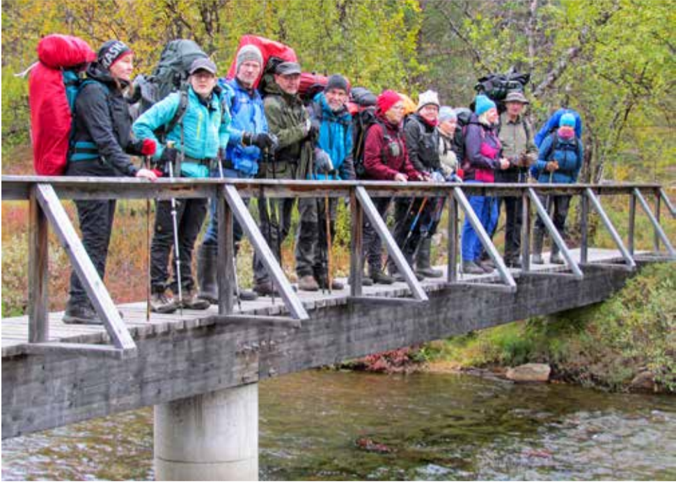
Mattis Ravadas joen silta kesti seikkailijat.

Kumpen perinteinen ruska- viikko elettiin tänä vuonna Inarissa 3-10.9.2022. Päivä- retkeläiset tutustuivat Inarin luonnon eri kohteisiin lähtien liikkeelle Inarin Kultahovista.