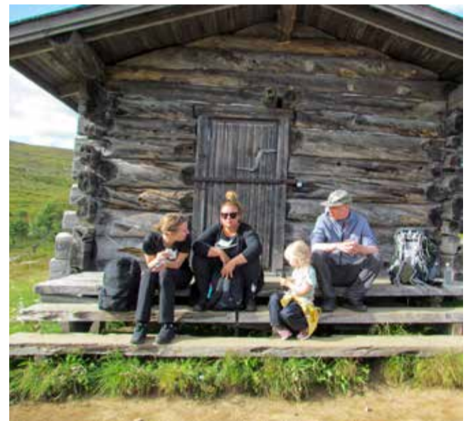
Nuorinkin jaksoi taivaltaa Pallaksen poropirtille.