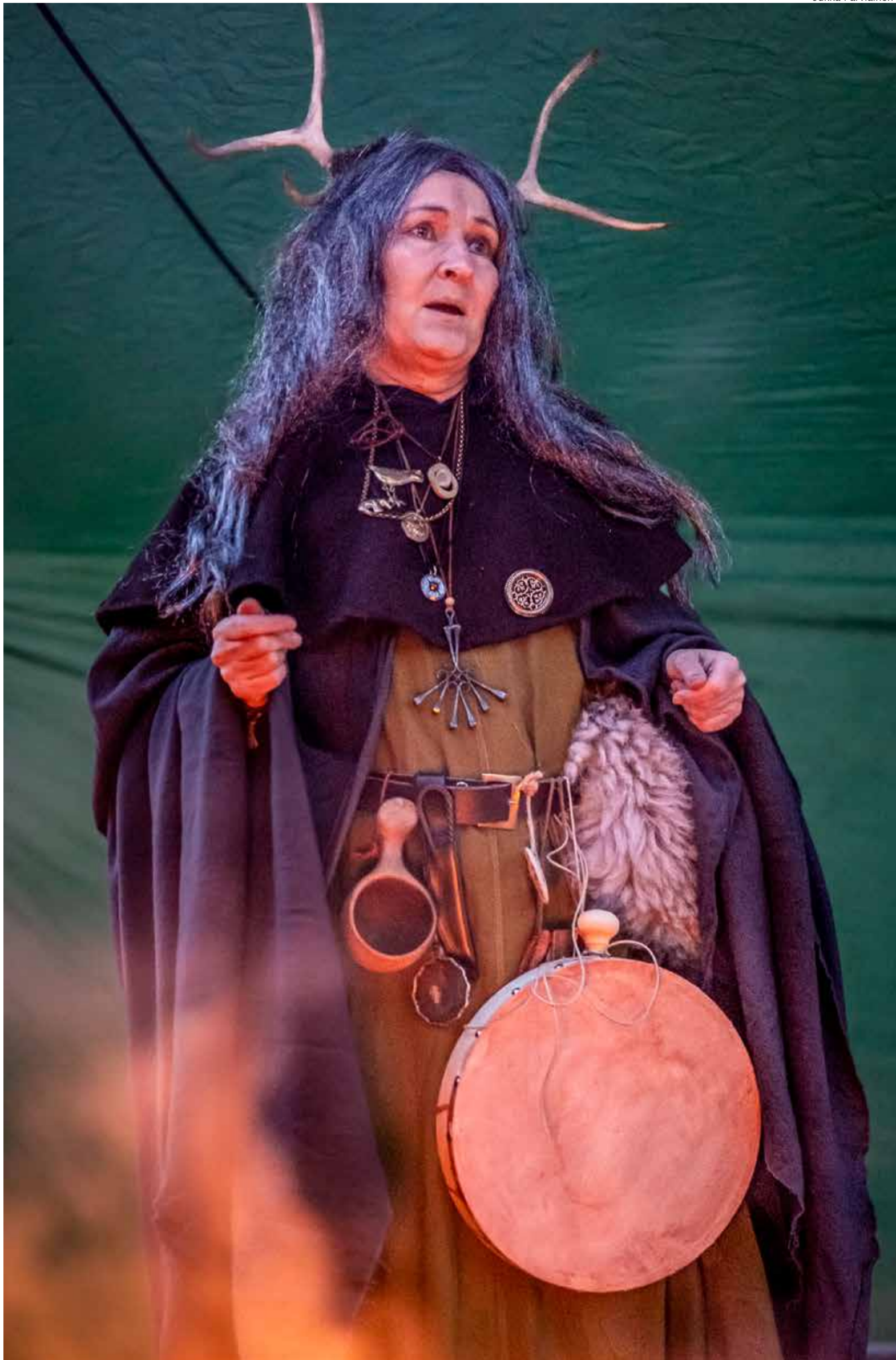
Rakkakolun noita huolehti susiseremonioista historiallisessa ympäristössä.