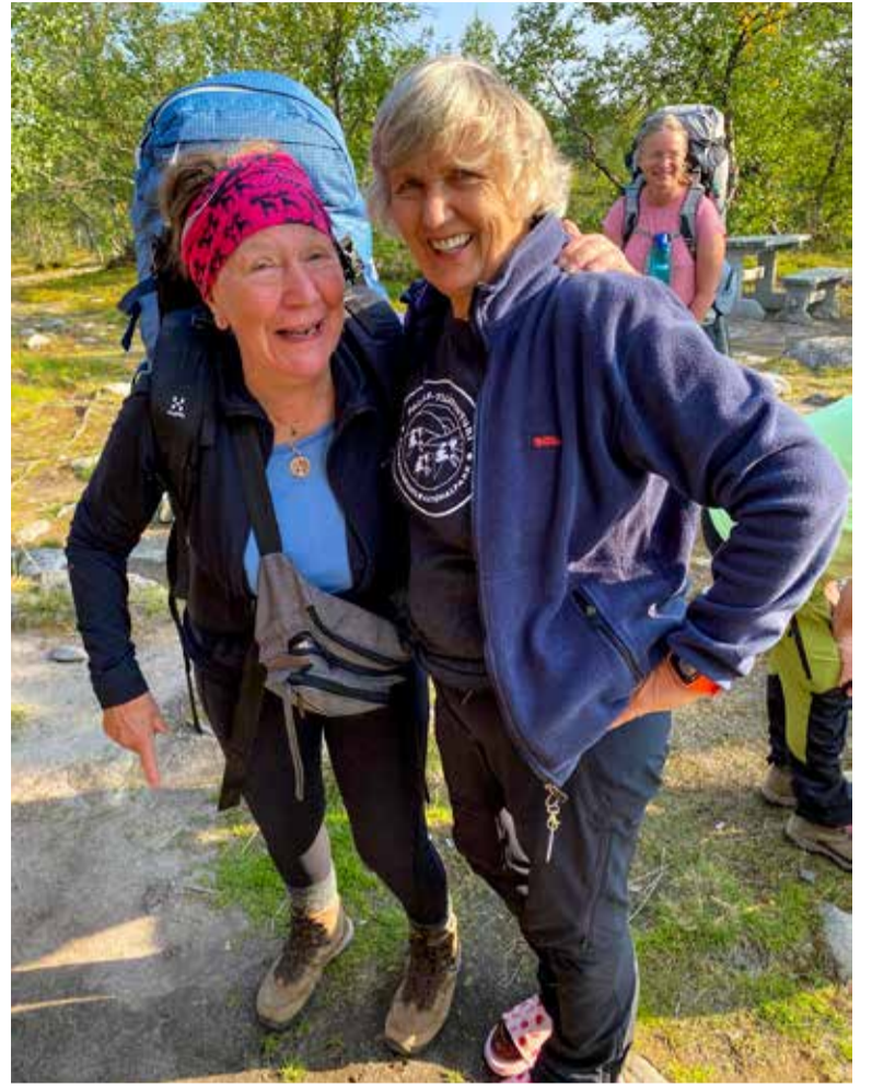
Aamulla saattelimme vaeltajat matkaan.

nä se nyt oli, Pöyrisjoki, mahtava, yli 10 metriä leveä pauhaava koski, syvä ja leveä koko kosken 300 metrin pituudelta.