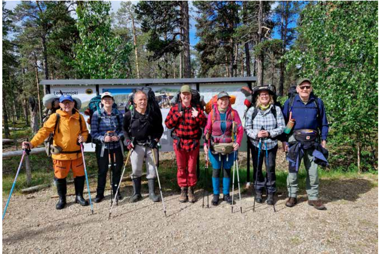
Vaeltajat lähdössä kohti Lemmenjoen kultamaita.

Morgamojalle päästyämme neljä majoittui Morgamojan autiotupaan ja muut kipusivat 83 askeleen verran rautaportaita ylös teltpaikalalle. Ilta meni nuotiolla nuotiomakkaraa syöden ennen kuin oli aika siirtyä levolle.