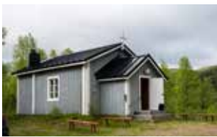
Nuvvuksen rukoushuone sijaitsee Tenojoen rannalla, Nuvvuksen kylällä.