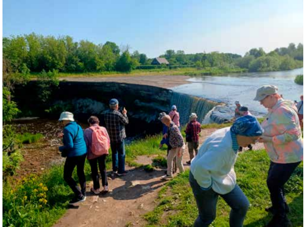
Jägalajoen putouksen päällä.

Alutagusen kansallispuiston maisemaa ihailimme Iisakun näkötorresta, johon lähes kaikki intoutuivat kiipeämään. Pyhtitsan Jumalanäidin nunnaluostarissa Kuremäellä näimme siunaustilaisuuden ja hautajaisaattokulkukeen loitompana olevalle hautausmaalle. Luostarin alueella huomiota kiinnitti muun muassa kor-