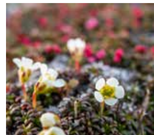
Uuvana, sitkeä ja äärimmäisen kylmänkestävä avotunturin pieni kukka.