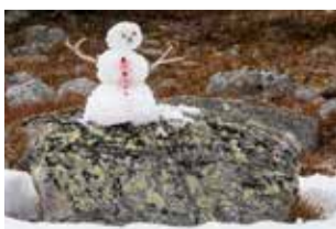
Viikolla alkoi tulla WhatsAppiin juhannustoitoksia. Tässä meidän juhannus lumiukko.