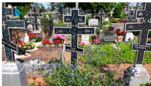
Vanhauskoisten Kallasten kalmisto.