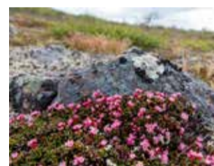
Tunturin tuulussa kukkii sielikkö – hennon vaaleanpunainen, mutta sitkeä kuin pohjoisen kesä itse. Nämä ovat Gáimmoáivi tunturin kupeessa.