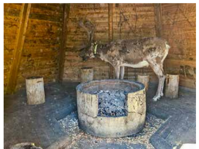
Poju-poro räkkää paossa Kultahaminassa.

Ahkun Tuvalla majoittuidumme, saunoimme ja söimme porokärstys-illallisen.