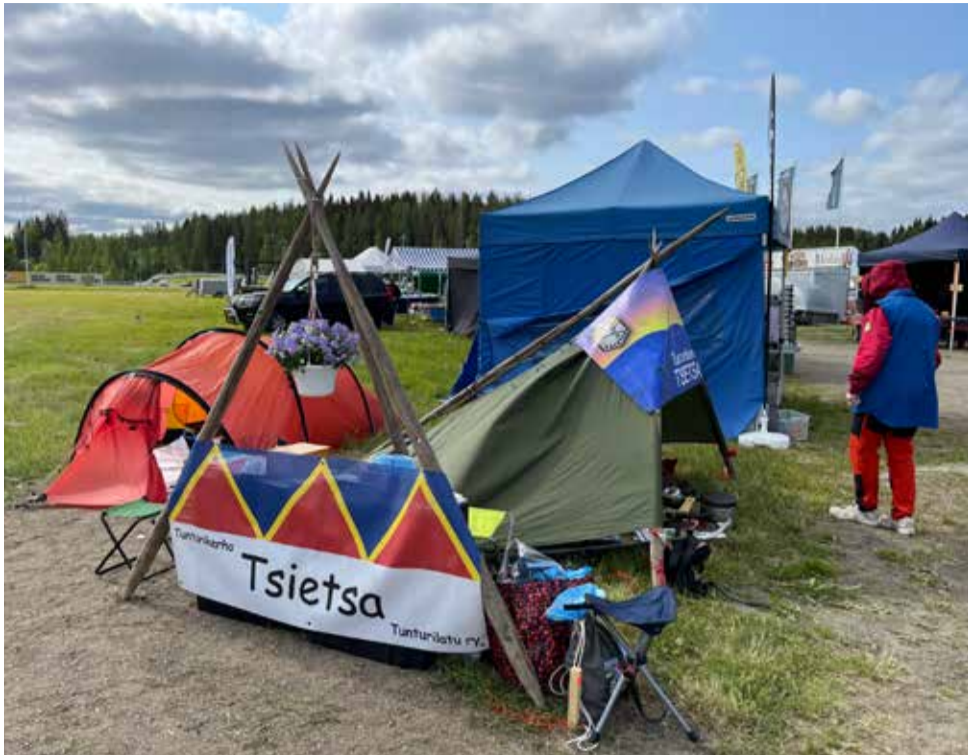
Tsietsan osasto oli luonnollisesti ulkona.