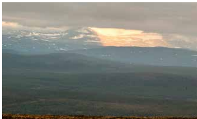
Keskiyön auringonsäteet Gáimmoáivin rinteellä. Valokeilassa näkyy Nuvvuksen Áilegagsen radiomastot, ja niiden takana kohoaa Norjan puolella oleva Rásttigáisa korkeuksiin.