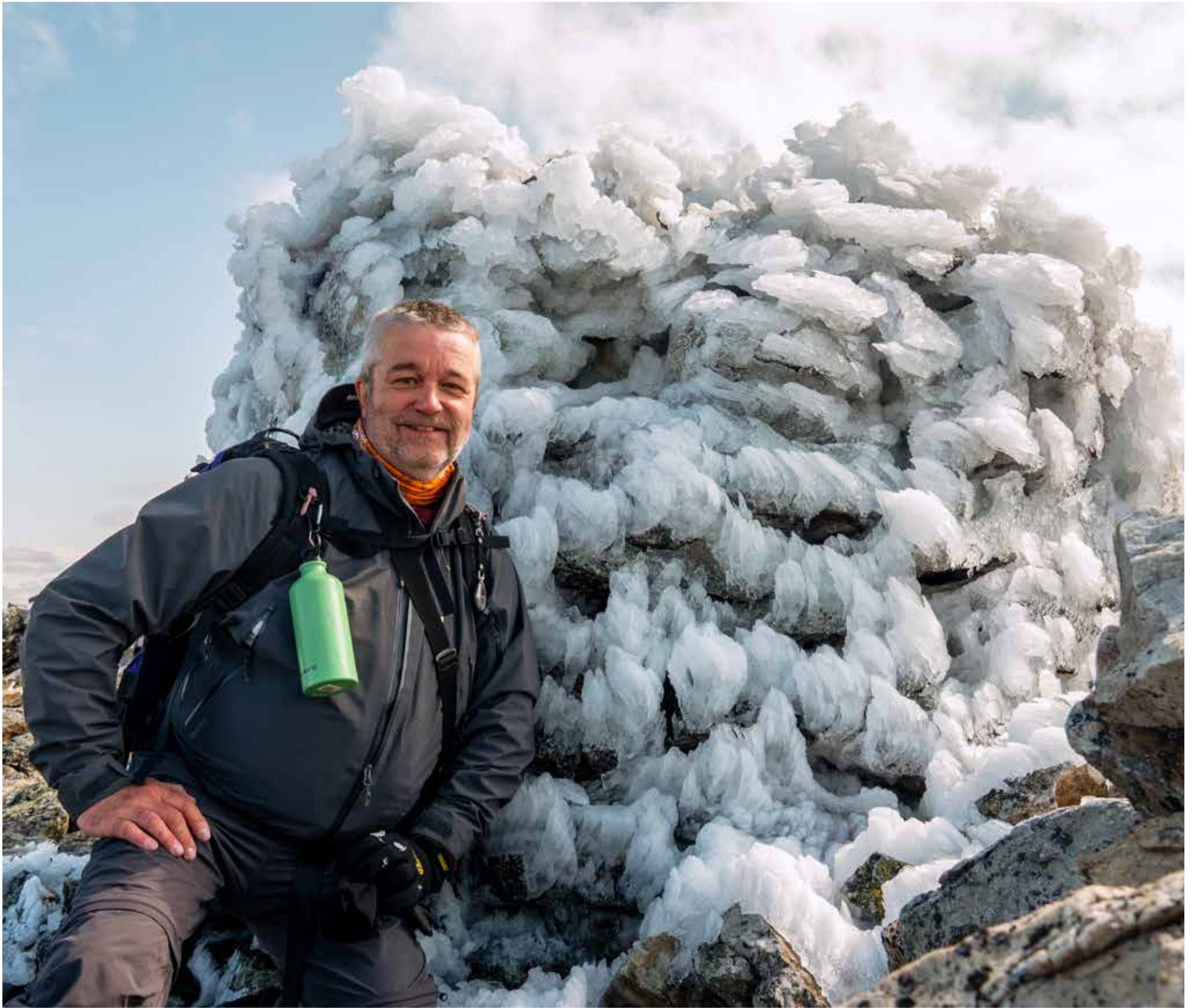
Rásttigáisá huiputettu. Tällä kertaa tunturien kuningas Hiisi oli suoepä ja päästi huipulle. Tarinan mukaan Hiisi popsii pakanoita ja poroja yhtenä suupalana, kuin hyttysiä.