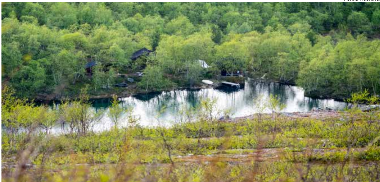
Giisajävi ja Susi-Kiisa Nuvvosskaidin rinteeltä kuvattuna.