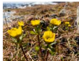
Jääleinnikkejä tunturin kupeessa. Nämä olivat Norjan puolella, minne myös teimme retken.