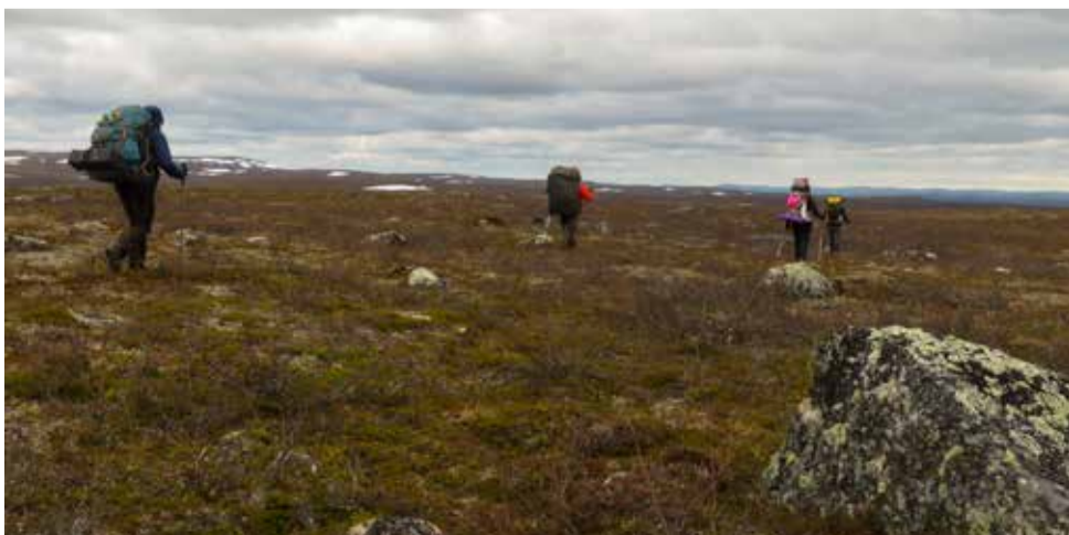
Hyväkulkuisia ylänköä on joutuisaa vaelttaa.

lä myös ihan täysikokoisia koivuja jäljellä.