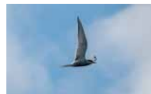
Lähdön hetki. Lapin tiira kävi vielä tervehtimässä kun olimme lähdössä taas Pohjanmaalle.