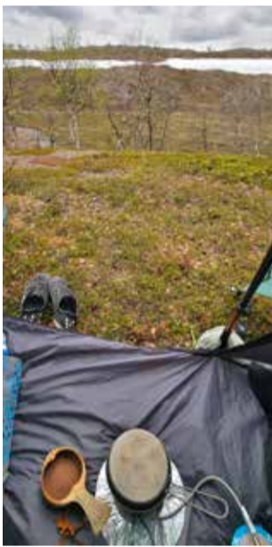
Iltapäiväkaakaot maisemien nauttien.

tiin ahkerasti sääennusteita ja päätettiin vaihtaa reitit suunnitelmaa. Aluksi ylitimme Nilijoen ja lähdimme kohti seuraavaa leiripaikkaa.