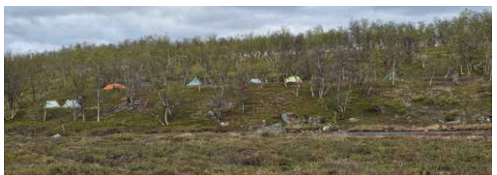
Leiri Nilijoen törmällä.