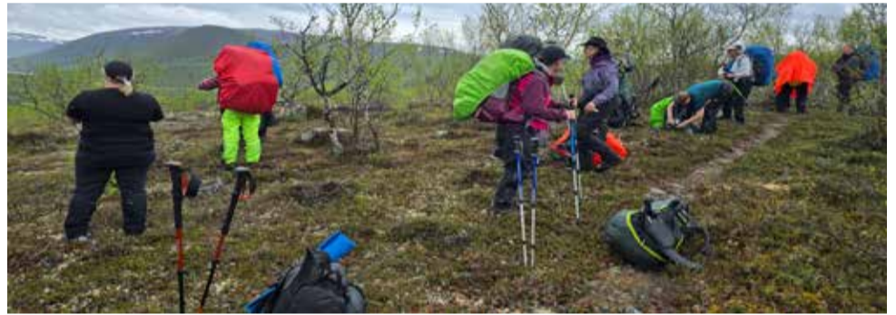
Tauko Nuvvus Ailigasta ihailen.