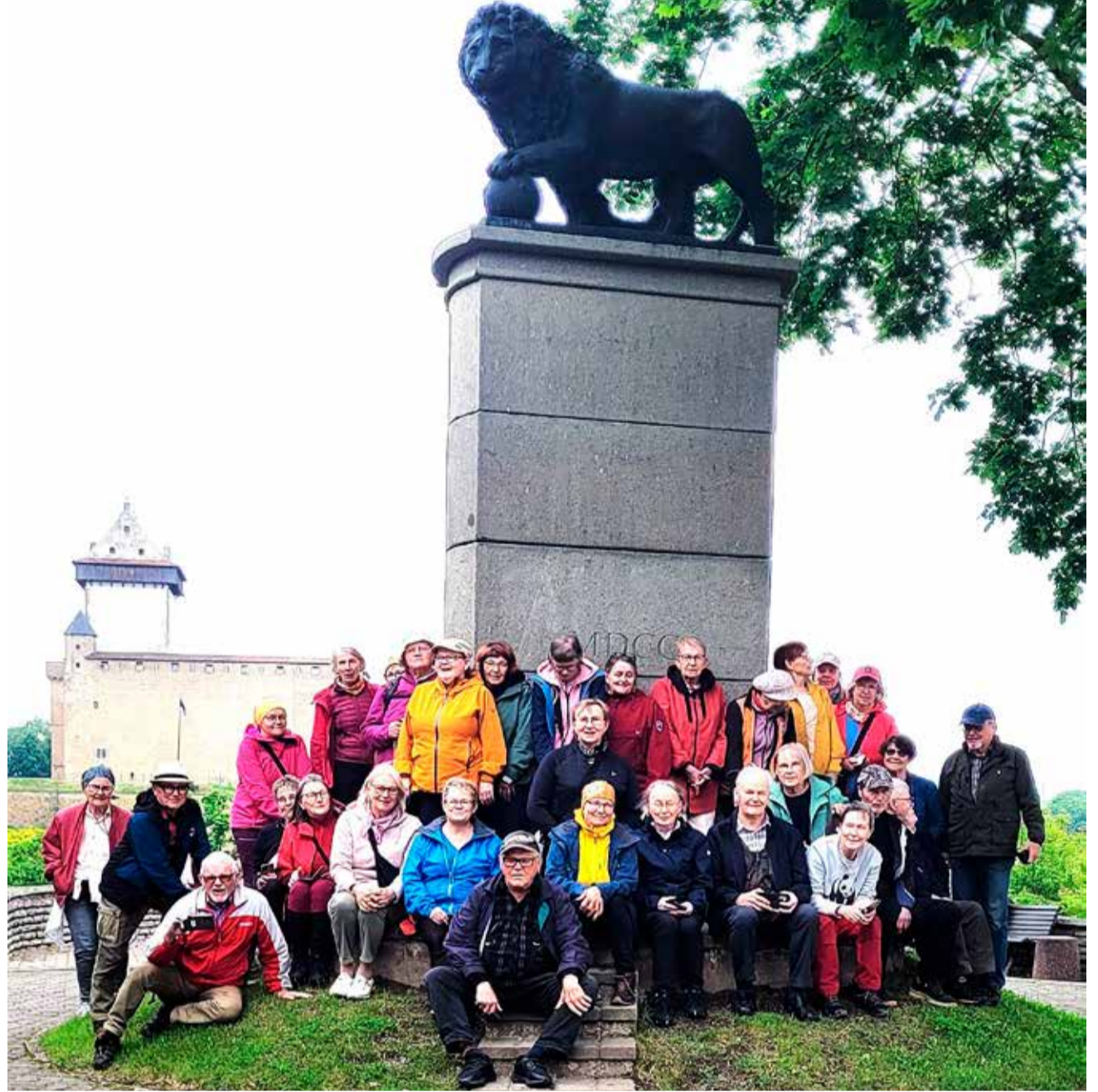
Narvan Ruotsin leijona.

nostavia, kun olet ollut mukana jo lukuisilla retkillä aikaisemminkin?