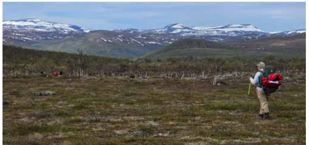
Rastegaisse naapureineen näkyi lähes koko matkan.

ma "väsynyt" leiriin kun ryhmän Rohkelikot lähtivät huiputtamaan läheistä Gaimmoaivi-tunturia.