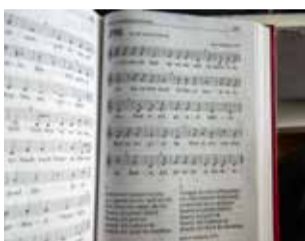
Messu oli kaksikielinen, suomen- ja saamenkielinen. Tässä tuttu virsi suomenkielisestä virsikirjasta virsi 135 – Jumala loi auringon, kuun.