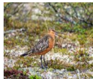
Punakuiiri maastossa. Näitä ei aivan jokapaikassa tapaa. Pesimäalueet Suomen pohjoisimmassa Lapissa. Silmälläpidettävä laji. Punakuiiri tekee maailman pisimmän tauottoman muuttolennon – jopa yli 11 000 km Alaskasta Uuteen-Seelantiin. Suomeen nämä tulevat Länsi-Euroopan rannikolta.