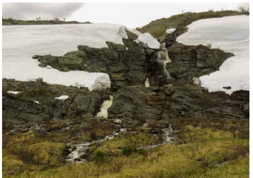
Putous Adolfin kammin lähellä.