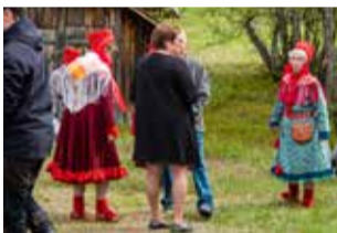
Rukoushuone oli aivan täynnä. Paikalla oli kyläläisiä, rippikoululaisia ja muutamia retkeilijöitä. Myös kyläläiset toivoivat, että Susi-Kiisasta osallistuttaisiin useamminkin Nuvvuksen kylällä järjestettyihin tapahtumiin, kuten messuihin, joita on noin kolme kertaa kesässä.