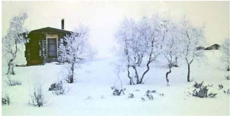
Rautulammen autiotupa vuonna 1989 kaamoksen kuurassa ja hämärässä.

Sisukkaasti he vain kohelsivat eteenpäin uuden puun oksalle tai lumikuoppaan. Pääsivät vihdoin kämpälle ja seurueessa oli viisi saksalaista nuorta, joilla oli yhtenä-