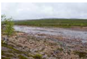
Uutisissa kertoivat, että Ke-von reitit suljettu, mm. tulvivien jokien takia. Ihmettelin tätä uutista. Kuvassa Nilijoki, jonka pääsi kuivin jaloin ylittämään.