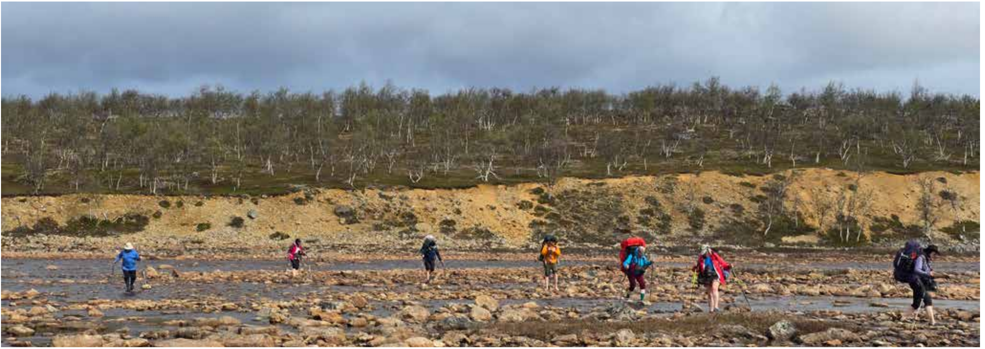
Nilijoen mutkassa oli helppo ylityspaikka.