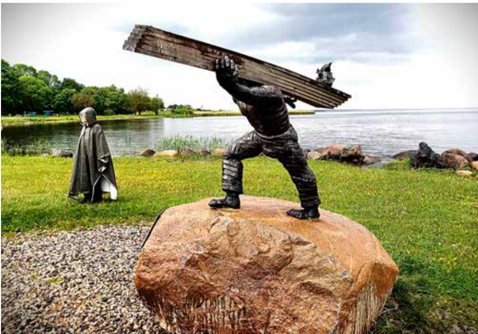
Kalev Poegin patsas Mustveessä.