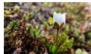
Niin kaunista, niin herkkää! Kauneimmat asiat löytyvät aivan meidän vierestä, kun vain osaamme katsoa.