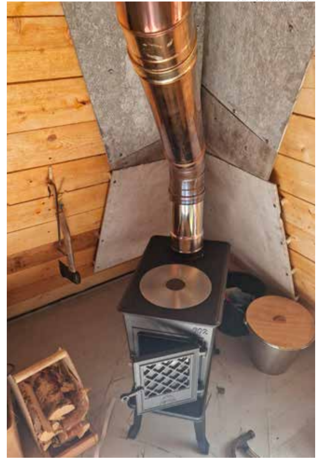
Uusi kamiina paikallaan.