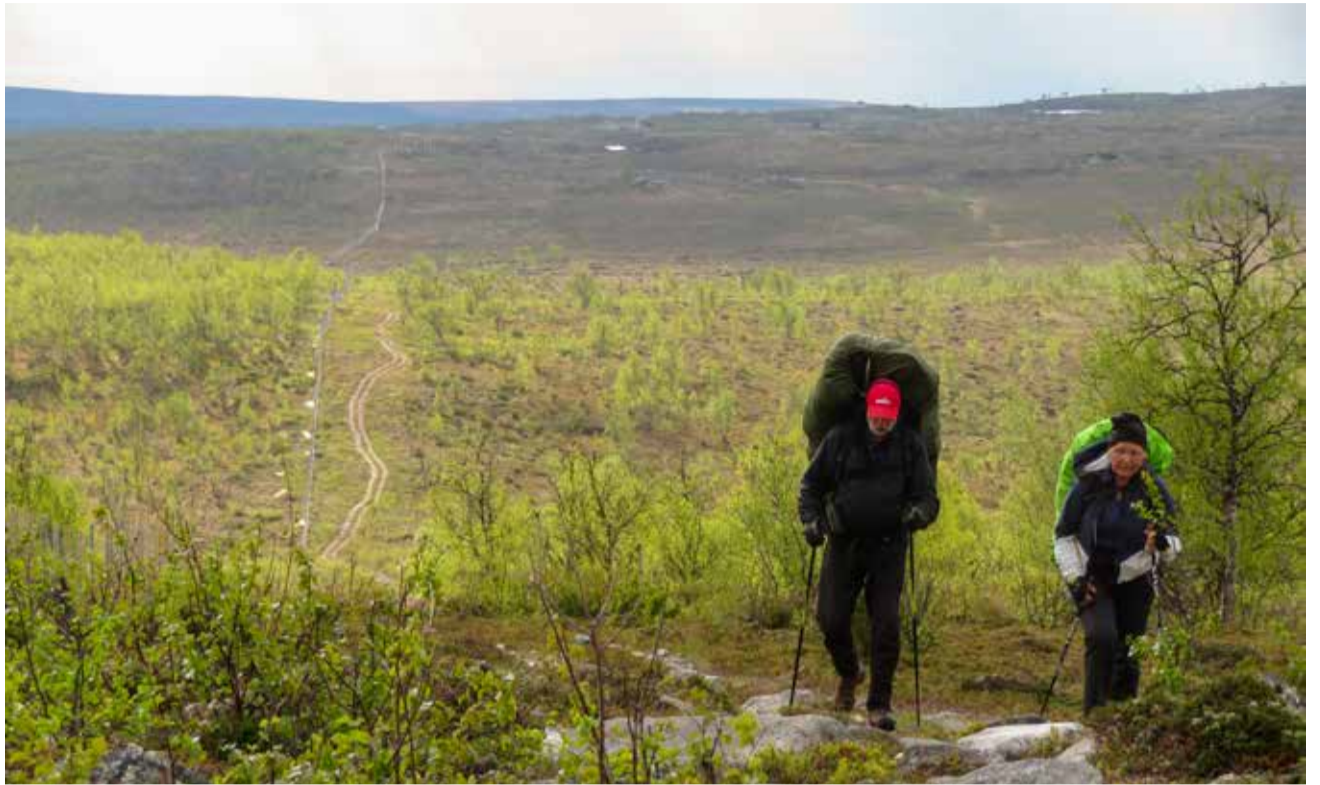
Maisema Urroavilta etelään Norjan rajalla.

Kaldoaivin alueella on laajoilla alueilla koivikot kuolleet autioiksi rankametsiksi mittariperhosten massasiintumien seurauksena. Melkoinen luonnonmullistus, joka vetää hiljaiseksi. Onneksi monin paikoin oli uutta pensaskorkkuista koivua kasvamassa ja siellä täällä