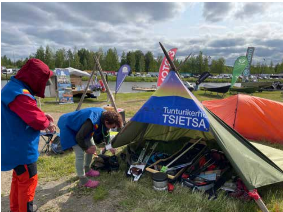
Kolmipäiväisten messujen aikana tarvittiin paljon talkooväkeä.