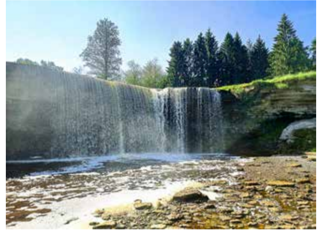
Jägalajoen putous alhaalta.

Ontikan kalkkikivitörmän (56 metriä) Valasten putous (30,5 metriä) on Viron korkein, mutta puro ruopattu 1800-luvun kuivausojista. Kuivana aikana se on mitätön liru ja käydessämme kuiva. Kierreportaat olivat särkyneet tippuneiden lohkariden vuoksi, joten paikka oli pieni pettymys, vaikka korkea jyrkänne ja rehevä lehto alhaalla näkyikin.