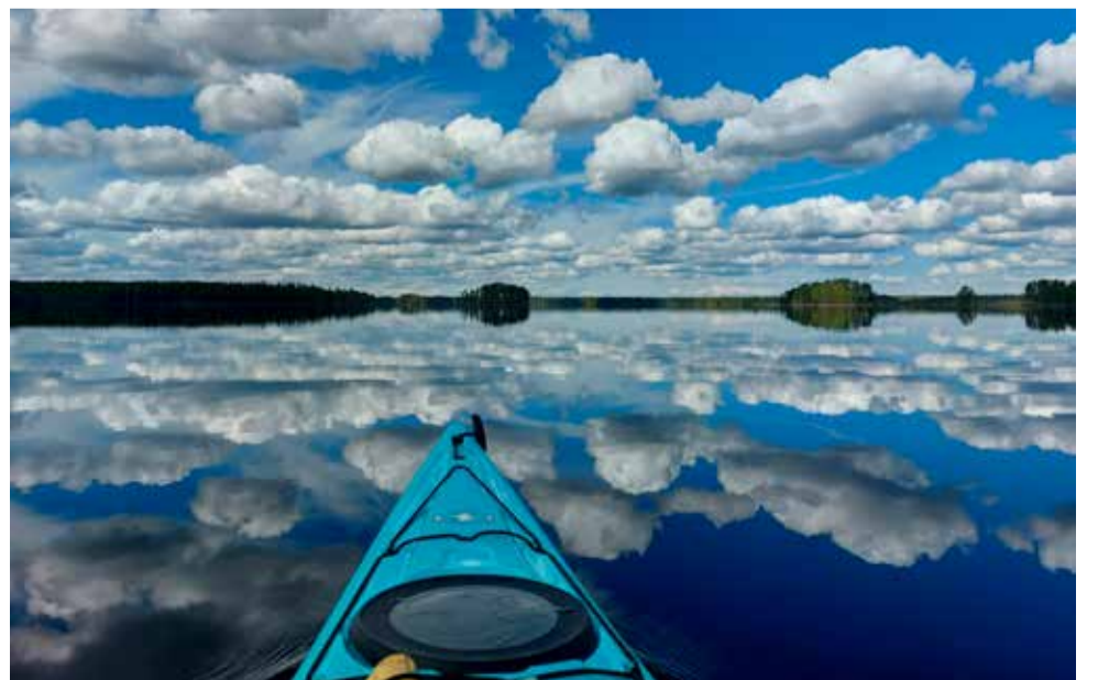
Mistä taivas alkaa?