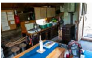
On aivan ihanaa, että ihmiset lahjoittavat tavaroitaan eteenpäin, mutta jossain menee raja. Susi-Kiisassa olisi ehdottomasti karsittava ylimääräistä (vaikkakin käyttökelpoista) tavaraa pois. Mielestäni 20 patalappua on liikaa. Myös tuikkukynttilöitä on varmasti seuraavaksi kymmeneksi vuodeksi.