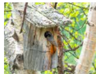
Susi-Kiisan pihamaan linnunpönttö oli myös varattuna koko kesän. Kiireinen Leppälintu ruokkii poikuettaan.