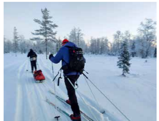
Kelkkaura helpotti matkantekoa kovassa pakkasessa.

Hiihdimme Kemihaaraan kuka mitenkin, Rakitsalta lähtevillä matkaa kertyi +kuusi kilometriä. Näin kolme riekkoa ja pupun. Autot käynnistyivät lämpöpaikkojen takia hyvin. Kylmäparkissa näin ei joka autolla ollut, eikä ollut ollut.