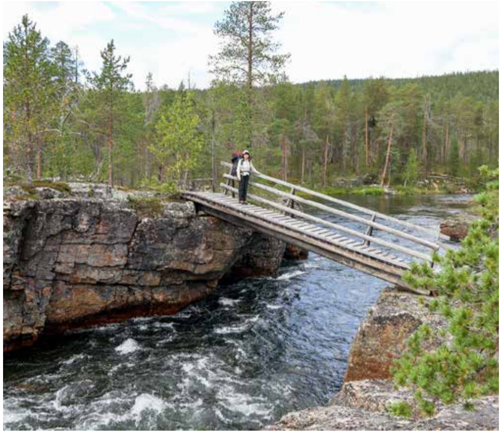
Porttikosken pieni, mutta tärkeä silta mahdollisti pitkään Suomujoen ylityksen helposti. Nyt se kuitenkin puretaan ja vaihtoehdoksi jää vain kahlaaminen. Matalalla vedenkorkeudella se ei ole iso ongelma, mutta tulvalla vaarallista.

–Jos onnistumme tässä, niin palveluissa, joita pää-