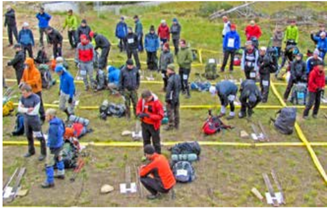
Kilpailijat odottavat lähtöruudussa lupaa tehtäväkäsän avaamiseen.