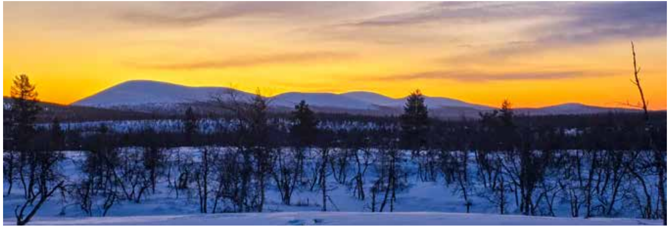
Lumikero, Vuontiskero ja Keräskero ja muut kerot Rouvuvuoman laidalta nähtynä

Tällä kertaa porukassa oli useampia osanottajia, jotka pääsivät nauttimaan kaamosvaeltamisen väreistä ja tunnelmasta ensimmäistä ker-