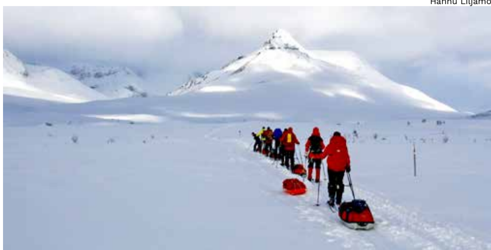
Owla vaeltamassa Pälotsalla kohti Gappoa.

Vuoden aikana yhdistyksellämme on useita lähiretkiä kuten Martimoaavalle kesällä ja talvella, Rokuan kansallispuistoon, Sankivaaraan Tervareitille sekä joulukuus-