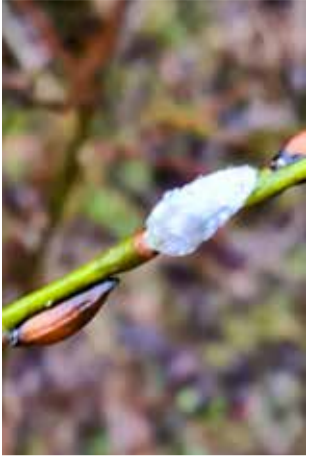
Pajunkissoja kuvattuna joulukuussa, hieman väärään vuodenaikaan.