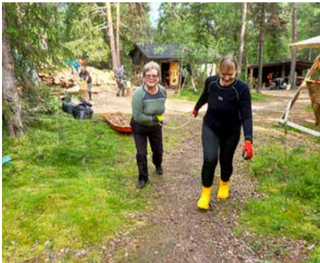
Talkoissa on tarjolla monenlaisia töitä, ja apukäsille on tarvetta.

Illat ovat vapaata yhteistä seurustelua tai mitä vaan kukin haluaa silloin tehdä. Toki päivälläkin voi lähteä retkelle