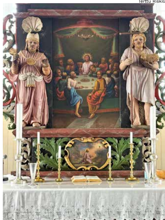
Nessebyn (Uuniemen) kirkon huikea alttaritaulu.

vely matka alkoi kohtuullisella vastamaella. Niin ja olimme valinneet helpompikuluisen reitin, joka oli hieman pidempi. Upeat maisemat alkoivat heti kun puuraja ohitettiin. Hieman tuuleskeli ei ollut hyttysiä.