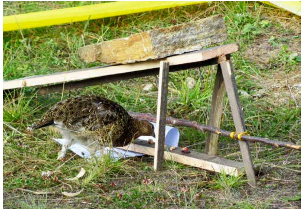
Riekko ei tajunnut mihin vaaraan on joutunut. Onneksi tämä ansa ei ollut herkimpiä laukeamaan.

Ansan valmistuttua partio aloitti vaelluksen seuraavalle tehtävärasille. Kiilopään kentällä oli sitten 60 erilaista viritettyä riekon ansaa, jotka odottivat kisan toimitsijoiden